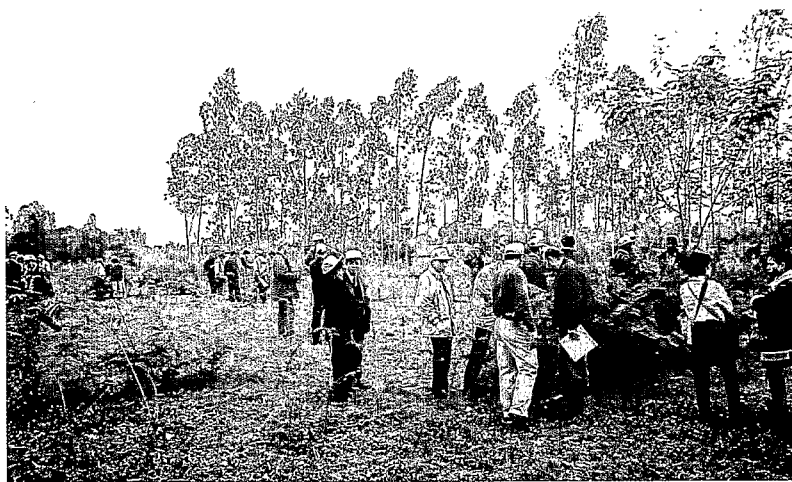
Essai international de différentes espèces de Leucaena au Vietnam (région de Hanoi). International testing of different Leucaena species in Vietnam (Hanoi area).

acides, et ce malgré l'utilisation de nouvelles espèces ou la création d'hybrides.