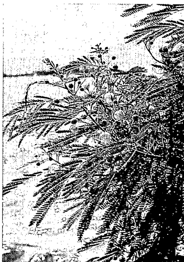
Leucaena leucocephala en Nouvelle-Calédonie Leucaena leucocephala in New Caledonia

Cet Atelier faisant suite à celui de Bogor (Indonésie) en 1994, qui avait vu la création du réseau Leucnet (cf. encadré p. 75), avait pour but de faire un bilan des quatre années écoulées, de discuter notamment des résultats obtenus à partir des orientations de départ et d'identifier les thèmes à approfondir dans le futur.