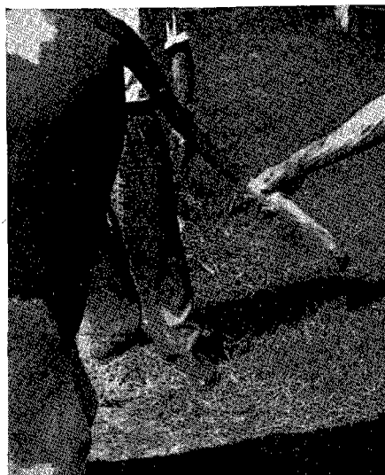
Fig. 3. — Chute de l'extrémité de la queue.

n'est pas atteint dans son état général. Tout au plus peut-on constater un léger amaigrissement.