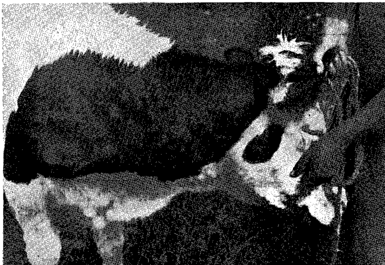
Fig. 1. — Nodules volumineux sur la face latérale de l'encolure.

vive irritation se traduisant par un larmoiement sanieux. L'œil est parfois touché et l'on observe alors une kératite avec opacification cornéenne très nette. La muqueuse nasale, elle, s'ulcère en de