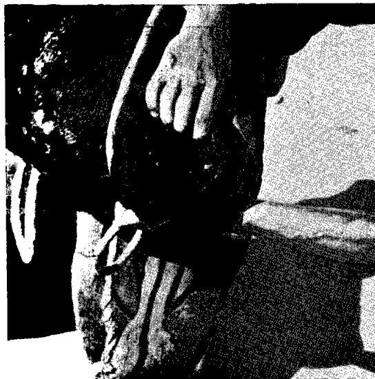
Fig. 4. — Ulcération de la muqueuse nasale.

zone inflammatoire. Toutefois, jamais des inclusions intracytoplasmiques n'ont pu être décelées. De telles inclusions furent décrites par les auteurs sud-africains sur des coupes de nodules prélevés précocement.