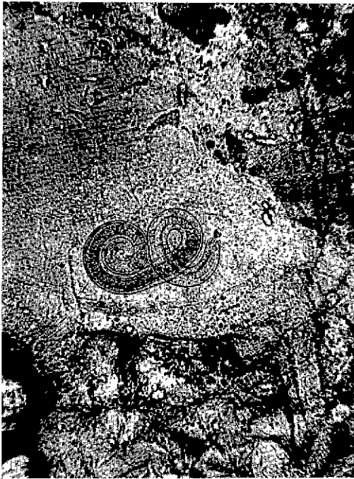
Photo 4. — Larve vivante placée dans un kyste aux parois indistinctes et très minces (muscle de rat).