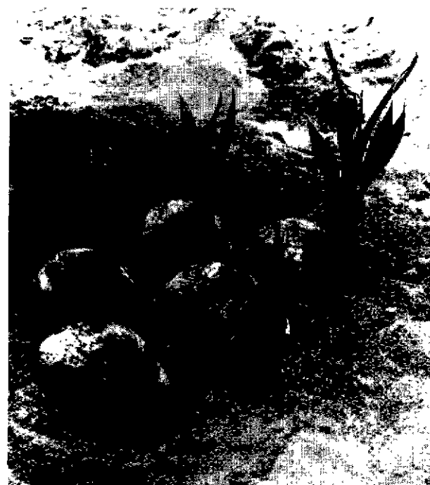
FIG. 2. — Aspects de plants anormaux (Appearance of abnormal plants).

devient très élevé pour les noix de 10 mois et moins (Tabl. VI), il approche 100 pour les noix de 7 et 8 mois.