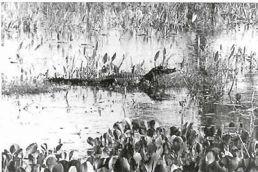
Faune sauvage au Pantanal