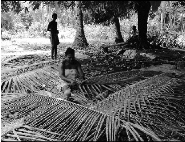
Photo 2. Confection de nattes en feuilles de cocotier à Ambryn, Vanuatu.