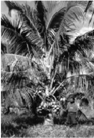
Photo 1. Grand Vanuatu amélioré âgé de 4 ans.