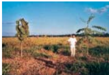
La croissance des plants est très hétérogène. Ici, deux plants de teck ( Tectona grandis ) et de parica ( Schizolobium amazonicum ) qui dominent les autres.

Une demande spéciale de brûlage contrôlé a été adressée à l'Ibama (Instituto Brasileiro do Meio Ambiente e dos Recursos Naturais Renováveis), autorité brésilienne octroyant ces autorisations. Une réponse positive a été donnée en juin 1999. Mais une interdiction générale de brûlage dans l'ensemble de l'État du Mato Grosso a été décidée quelques jours plus tard. Cette pratique a alors été écartée. En revanche, une application d'herbicide (glyphosate) a été réalisée, en juin 1999, sur 765 ha.