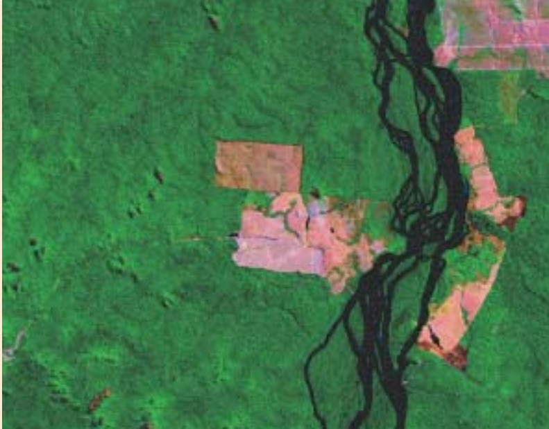
Vue satellitaire de la fazenda. Au centre, la zone de la plantation. Satellite view of the fazenda. The plantation zone is in the centre.