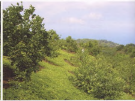
Couverture d'Arachis pintoï dans un verger sur pente