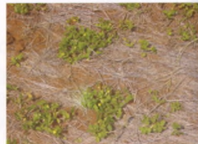
Jeune Arachis pintoï sur paillage