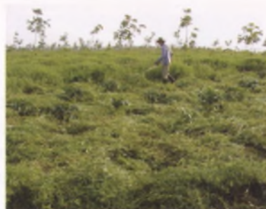
Fauche de Stylosanthes guyanensis dans une plantation de café et d'hévéa (Pleiku)

D'autres espèces, en particulier Stylosanthes guyanensis peuvent être utilisées comme couverture dans les plantations. Il peut être contrôlé par simple fauche.