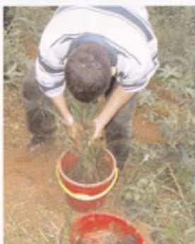
Trempe des boutures dans une solution d'argile, de bouse et d'eau.