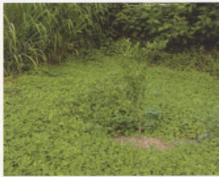
Couverture d'Arachis pintoï dans un jeune verger (1 an)