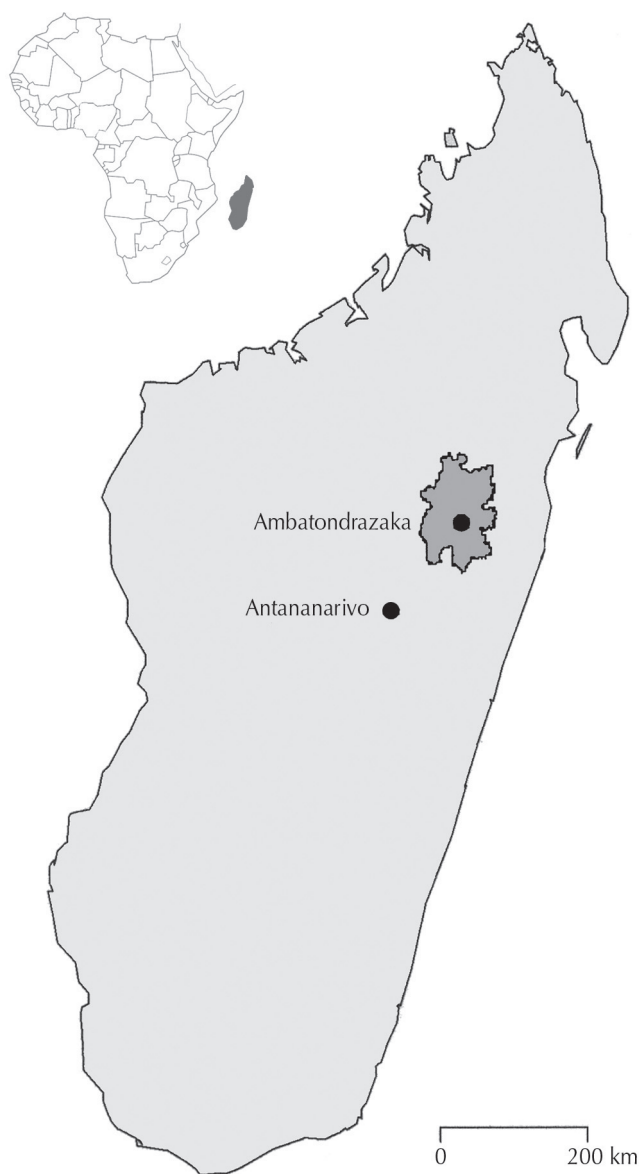
Figure 1 : zone d'étude de l'épidémiologie de la peste porcine africaine à Madagascar.

Sud malgache en 1998, et dans la région du lac Alaotra dès la fin de cette même année, a entraîné une réduction drastique de la population porcine qui est passée, selon les statistiques des services vétérinaires régionaux, de 50 000 (1997) à 5 000 (2004) têtes en effectifs instantanés (5, 10). Les plus grosses exploitations porcines ont disparu, le système subsistant étant constitué de quelques exploitations de type naisseur-engraisseur et d'une majorité de petits engraisseurs (moins de six porcs à l'engrais dans les deux tiers des cas) pour lesquels l'élevage porcin est une activité secondaire.