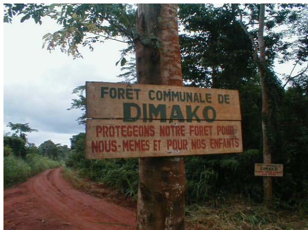
Une piste d'entrée de la Forêt Communale de Dimako