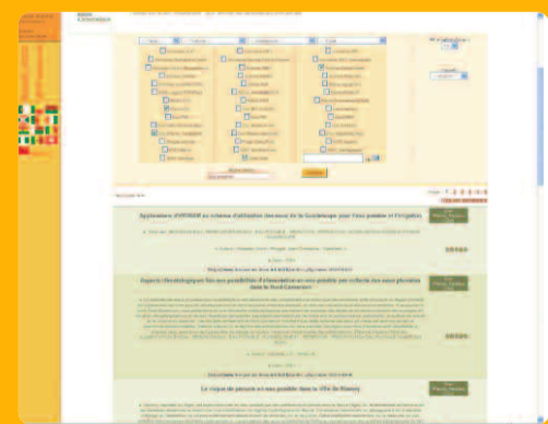
Exemple de résultat de recherche fédérée