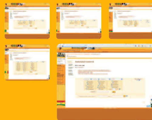
Example of home pages for SIST websites

SIST, scientists gathered around an innovative, free and open Internet platform