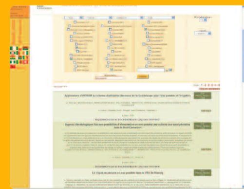
Example of a results page following a SIST engine search