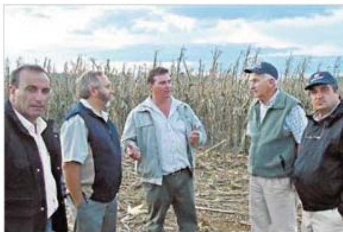
. / GENTILIEZA MARIO BRAGACHINI/INTA