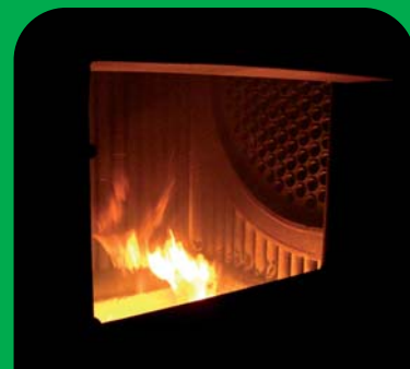
Foyer d'une chaudière à bois produisant de la vapeur pour une turbine, Brésil.