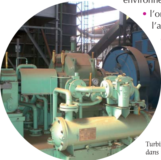
Turbine à vapeur de 1 000 kW fonctionnant dans une scierie à Belem, Brésil.