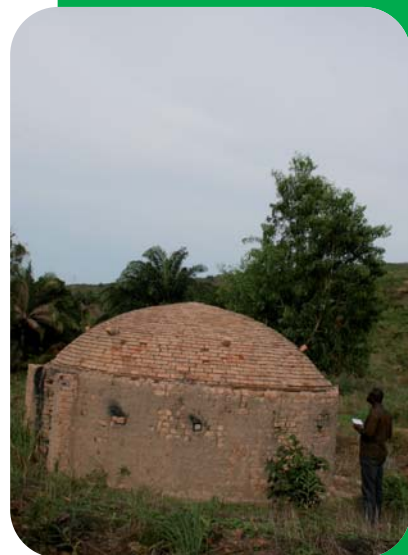
Four de carbonisation maçonné, République démocratique du Congo.