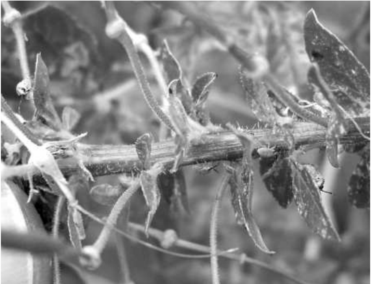
Fig. 1. – Adultes et larves d' Eurystylus bellevoeyi sur Gynandropsis gynandra (Birni N'Konni, Niger, Juillet 2010).

d'amélioration variétale (AVRDC à Arusha en Tanzanie, Zambia Seed Company), notamment en Zambie et au Kenya où ses semences sont commercialisées. Bien que peu attaqué par les Insectes, ce qui peut être mis en relation avec les propriétés insecticides ou insectifuges de certains de ses extraits, plusieurs Punaises Pentatomidae figurent dans la liste des ses Insectes ravageurs (genres Nezara , Acrosternum , Agonoscelis et Bagrada ), mais aucun Miride n'avait à ce jour été signalé.