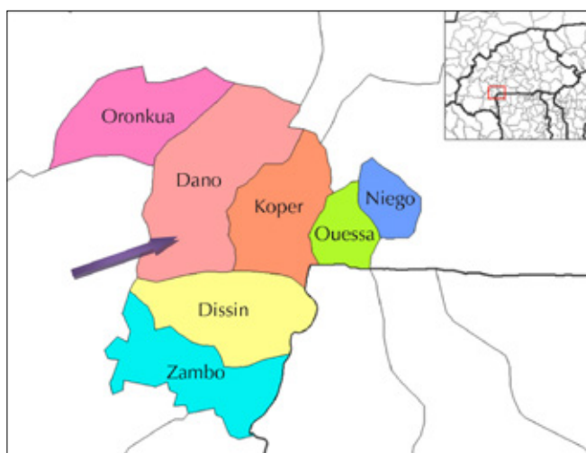
Figure 1 : localisation de la commune de Dano au Burkina Faso.

Les jachères pratiquées dans la zone sont de courte durée. La fertilisation des terres dépend des quantités de fumure organique apportées. Les apports d'engrais minéraux, encore faibles, sont liés à la culture du coton, puisque la compagnie cotonnière distribue à crédit des intrants (engrais et pesticides) dont le coût sera déduit des recettes générées à l'issue de la récolte. On observe une progressive apparition des pratiques de conservation des sols, telles