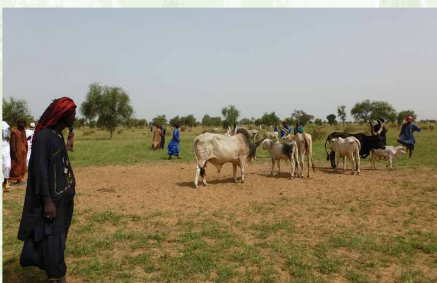
Bovins en vente au marché de Niassanté, Septembre 2013