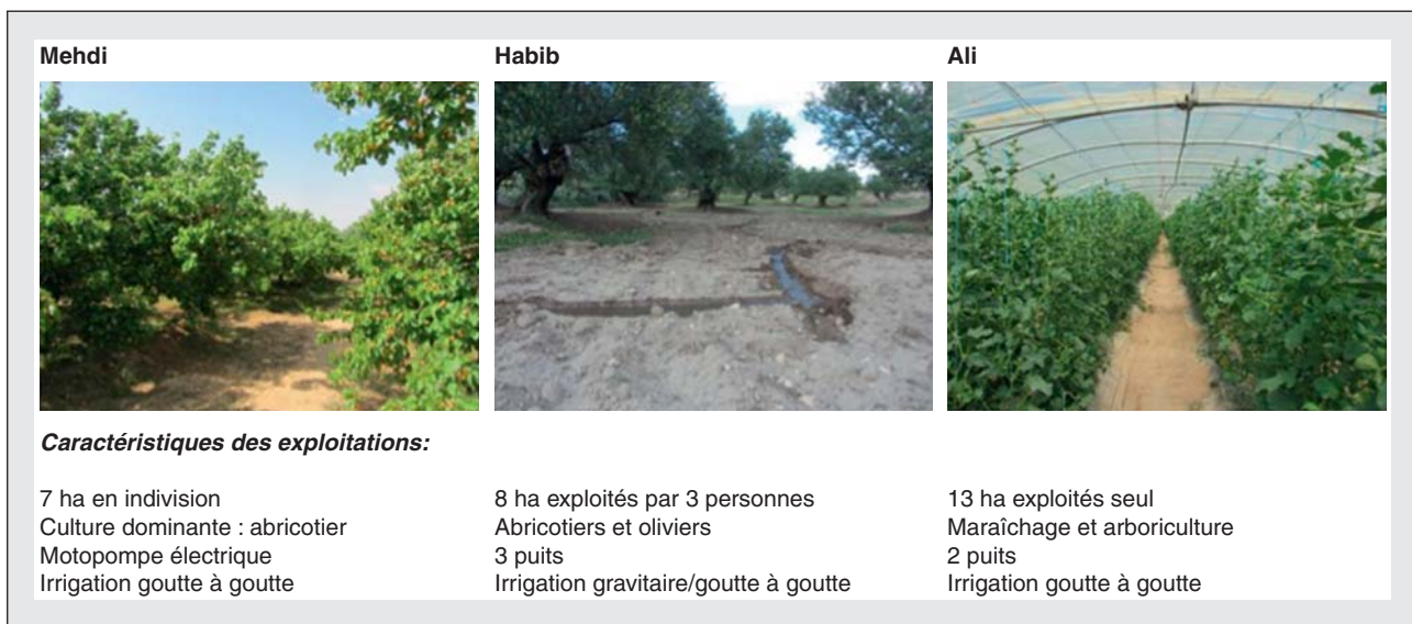
Figure 3. Portrait des exploitations de trois jeunes agriculteurs.