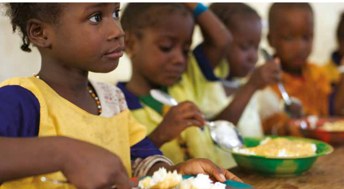
Restauration scolaire en Guinée. Julien Harnais.

368 millions d'enfants bénéficient de l'alimentation scolaire dans le monde dont 47 millions en Asie de l'Est et dans le Pacifique, 121 millions en Asie du Sud, 85 millions en Amérique Latine et aux Caraïbes et 30 millions en Afrique Subsaharienne (PAM, 2013). Le nombre d'enfants touchés par un programme de restauration scolaire en Afrique Subsaharienne est largement en dessous des besoins. Selon l'AFD, les capacités des collectivités locales à mettre en place des dispositifs de restauration scolaire nécessitent d'y être largement renforcées.