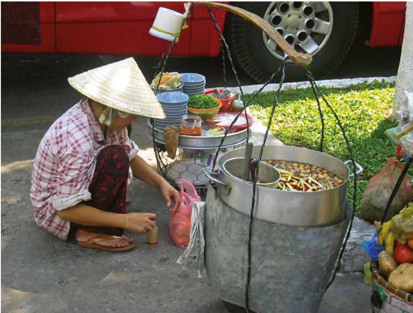
Vendeuse de rue à Ho Chi Minh (Vietnam). Thomas Schoch.

L'alimentation de rue contribue à une grande partie des apports nutritionnels des citadins : 50% à Abeokuta (Nigéria), 46% à Ouagadougou (Burkina Faso), 25% à Port-au-Prince (Haïti) ou encore 19% à Hyderabad (Inde) (Steyn et al. , 2013).