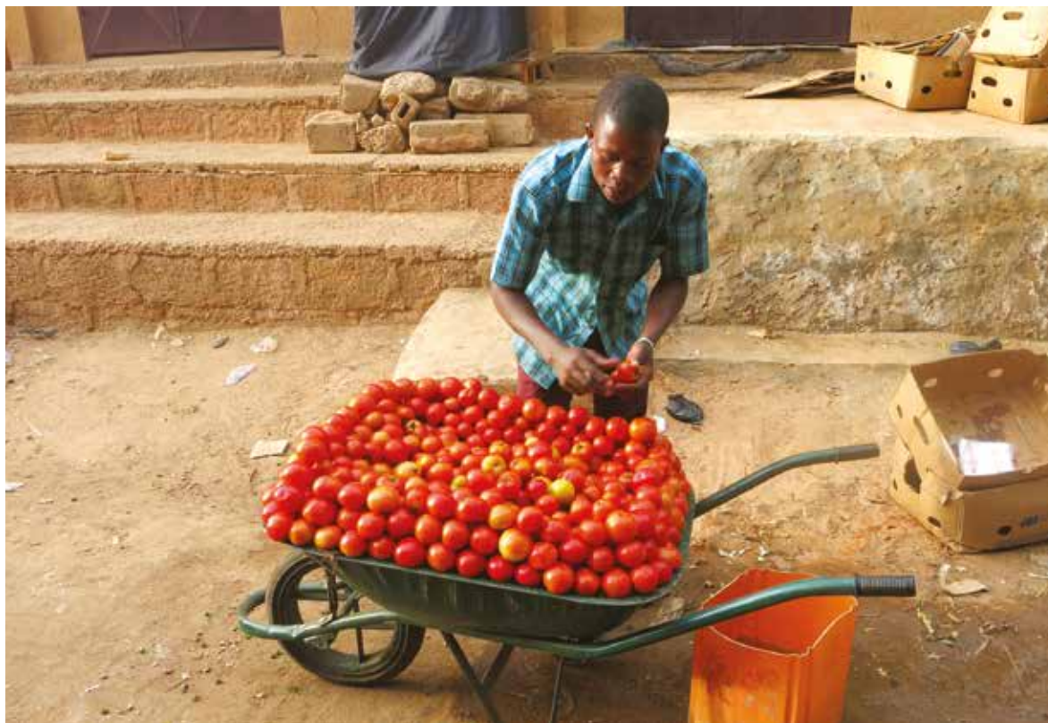
Vendeur informel de tomates au Niger. Benjamin Michelon.

planification urbaine. À Maputo (Mozambique), tous les secteurs de l'activité économique dépendent du secteur informel pour l'approvisionnement en matières premières. La ville a donc fait le choix d'encadrer ces ventes informelles et a commencé par réaliser une enquête auprès des vendeurs informels, afin de mieux les connaître notamment en termes de potentiel fiscal.