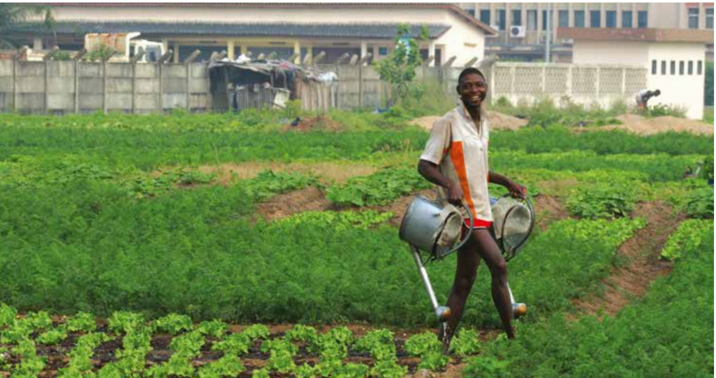
Cultures maraîchères en zone urbaine à Cotonou au Bénin.

Un rapport de la FAO basé sur de nombreuses études de cas des pratiques en matière d'agriculture urbaine et péri-urbaine en Afrique montre que cette activité y est très importante. Elle est ainsi pratiquée par 35% de la population à Lilongwe (Malawi) et Yaoundé (Cameroun), par 30% – soit 1 million de personnes – à Nairobi (Kenya) ou encore 25% à Accra (Ghana). Ces études soulignent que ce sont surtout les femmes qui sont actives y compris dans les activités de commerce associées. Elles représentent 70% des producteurs à Bissau (Guinée B.) ou à Brazzaville (Congo) (FAO, 2012).