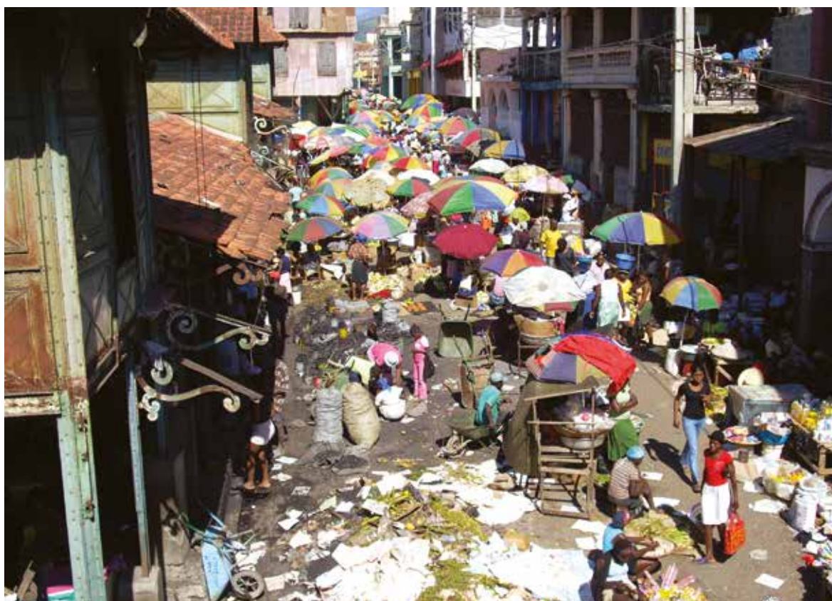
Encombrement et déchets engendrés par un marché urbain à Haïti. Benjamin Michelin.

bue à la typicité et à la culture alimentaire des pays et des villes. C'est pourquoi certaines villes, plutôt que d'essayer d'éliminer le secteur informel, cherchent plutôt à l'accompagner ou au moins à en tenir compte dans leur gestion et leur politique.