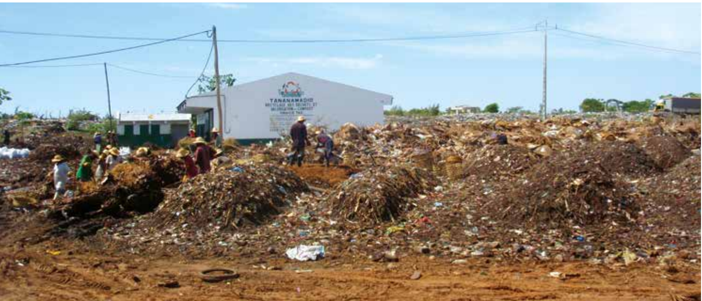
Compostage de déchets urbains à Mahajanga (Madagascar).