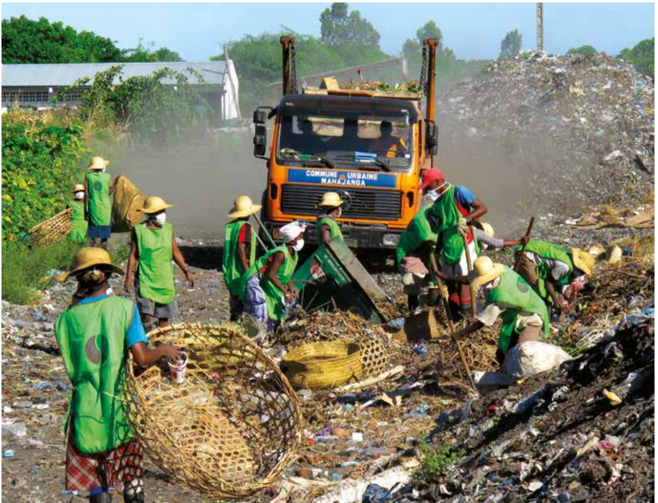
Travailleurs du projet Africompost sur l'unité de compostage de Mahajanga.

Projet historique de Gevalor, accompagné depuis 2001, l'unité de compostage est opérée par MADACOMPOST, une SARL qui recycle également les déchets d'abattoir et les sachets plastiques.