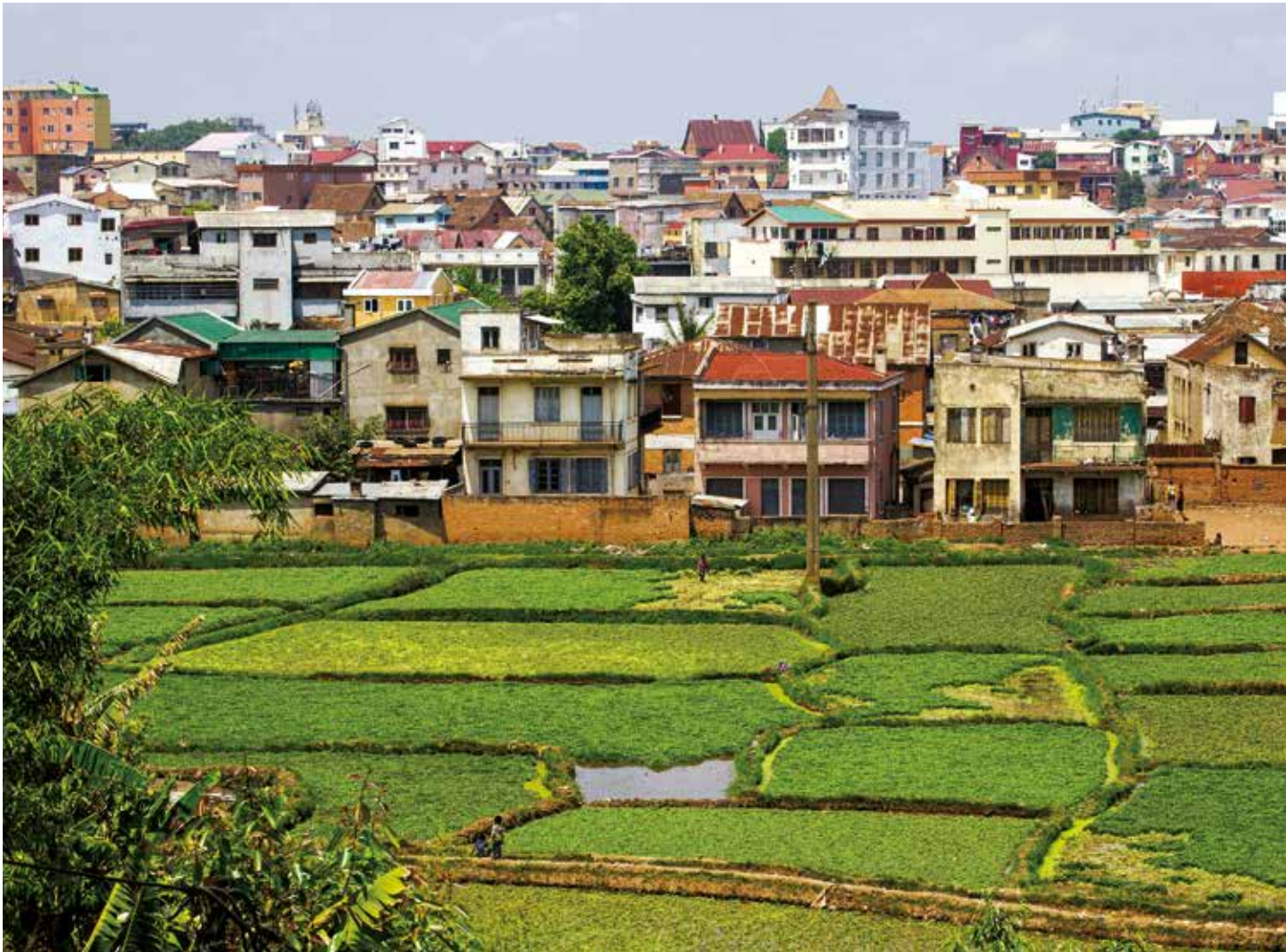
Le quartier populaire de Manjakaray à Antananarivo est bordé de rizières. Cyril le Tourneur d'Ison.

Les agricultures urbaines et péri-urbaines seules ne suffisent pas à nourrir les villes. Néanmoins elles sont pratiquées par 800 millions de personnes dans le monde (FAO, 1999) et sont complémentaires de l'agriculture « classique » rurale en fournissant une part non négligeable de la consommation urbaine pour certains produits: 80% des légumes à Dar es Salaam (Tanzanie) et à Accra (Ghana) (Cofie et al. , 2006) mais aussi 90% des œufs à Shanghai (Chine) (Yi-Zhang et Zhanen, 2000) et 20% du riz à Antananarivo (Madagascar) (Aubry et al. , 2014).