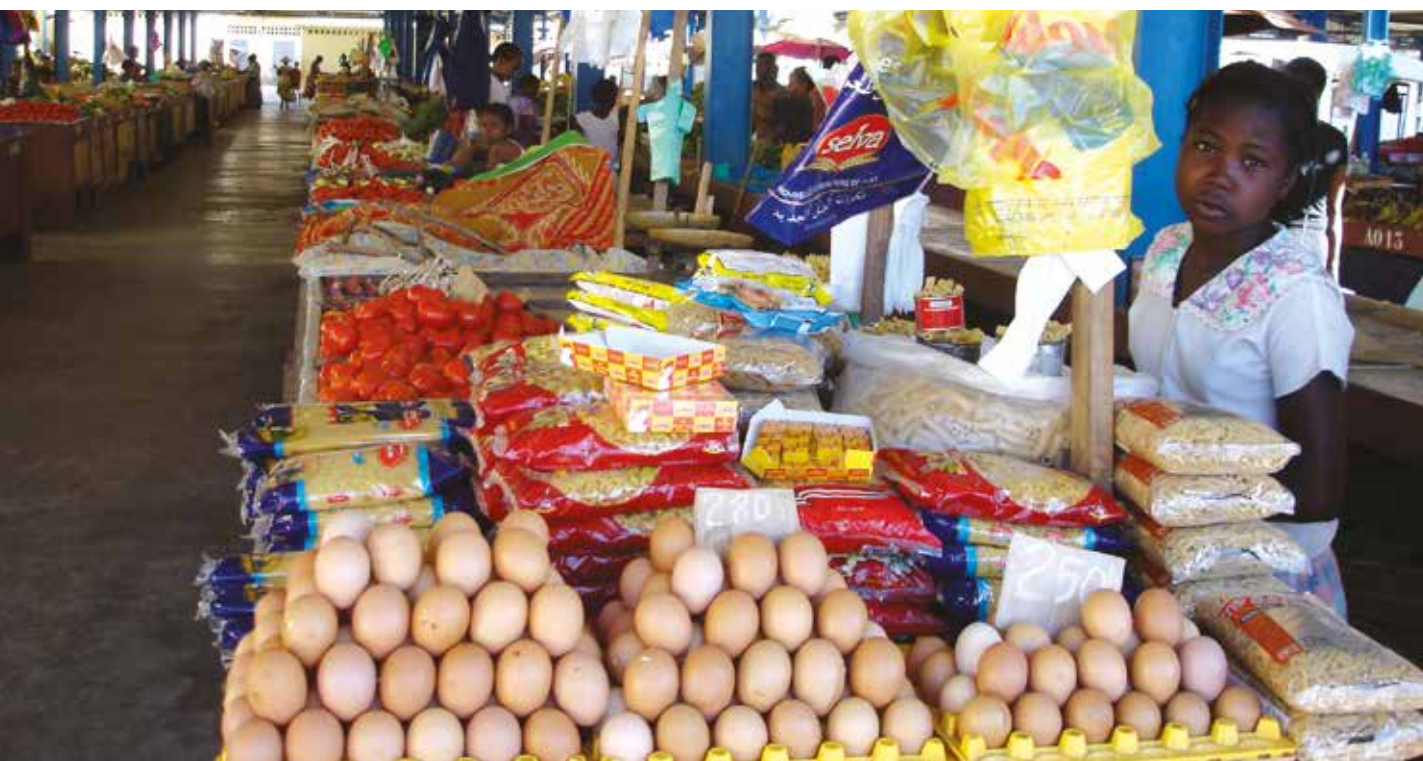
Le marché Mahabibo de Mahajanga suite à sa réhabilitation. Benjamin Michelon.