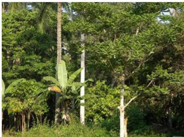
Vue de face d'une cacaoyère agroforestière

La région Centre du Cameroun est une zone de cacaoculture importante pour le pays. L'essentiel du verger cacaoyer y est constitué de systèmes agroforestiers où le cacaoyer est associé à de nombreuses espèces pérennes, aux usages multiples : fruits, bois de chauffe et d'œuvre, pharmacopée, outillage. Ces cacaoyères à la structure complexe et souvent très anciennes (> 60 ans) sont toujours exploitées par les agriculteurs et contribuent significativement au fonctionnement des exploitations dans lesquelles elles s'insèrent.