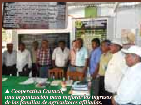
▲ Cooperativa Costach, una organización para mejorar los ingresos de las familias de agricultores afiliadas.

En el marco del programa "Empowering Smallholder Farmers In Markets (ESFIM)", equipos de investigación europeos (CIRAD, Wageningen University, Natural Resources Institute) trabajan en 11 países en colaboración con los productores que se organizan frente a los mercados. Los cambios y las innovaciones en las granjas familiares deben ser concebidos e implementados colectivamente. Las cooperativas desempeñan un papel central en la dinámica local en tanto que modalidad de acción colectiva.