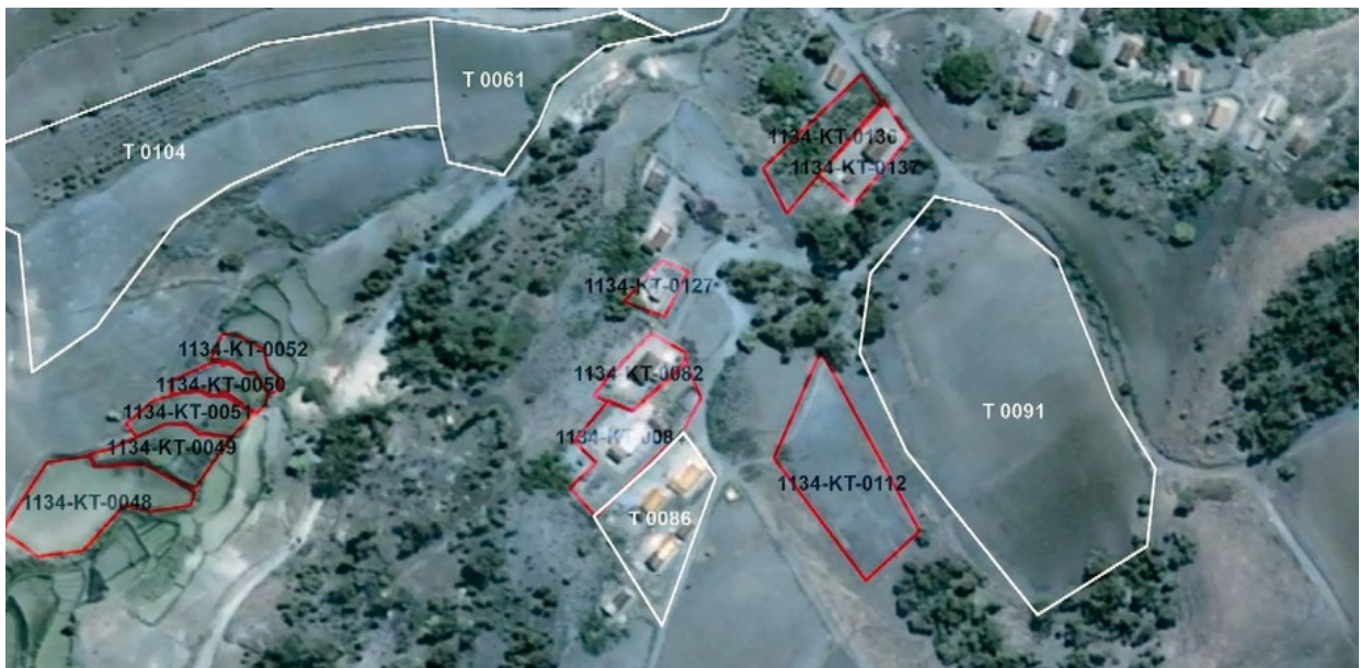
ILLUSTRATION 1 : Extrait de Plan local d'occupation foncière où apparaissent en blanc les limites de titres fonciers et en rouge celle des certificats

Ces deux systèmes de reconnaissance des droits sont soutenus par des acteurs de pouvoir socio-économique et politique très contrastés. Le système de l'immatriculation est défendu sur le terrain et dans les arènes de décision par des élites (cadres de l'adminis-