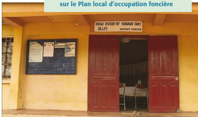
ILLUSTRATION 1 : Guichet foncier, et agents du guichet communal en train d'inscrire les certificats sur le Plan local d'occupation foncière