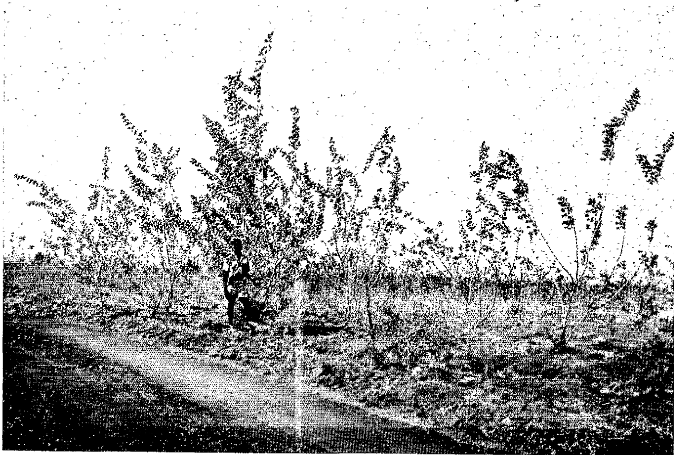
Dalbergia sissoo — plantations de 2 ans