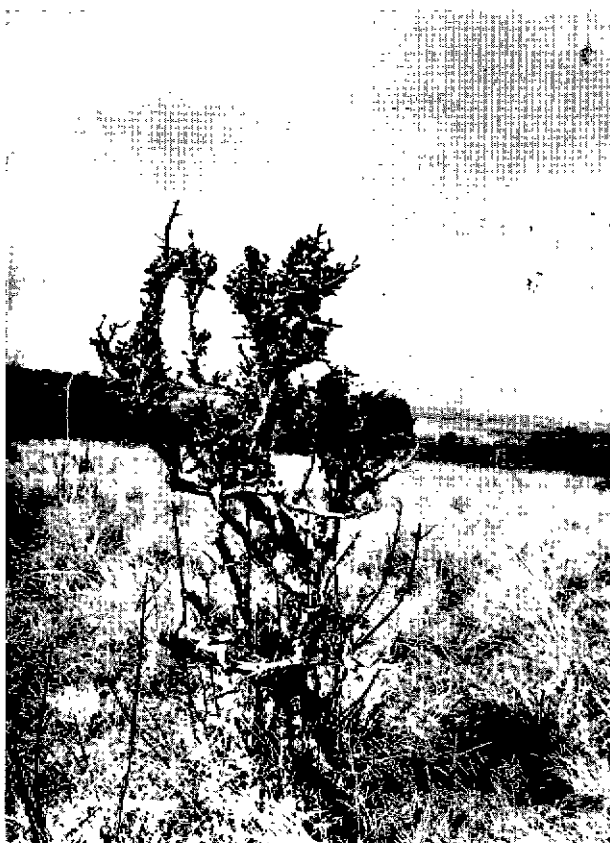
Fig. 1. — Les Gardenia sont ébourgeonnés au ras des rameaux.