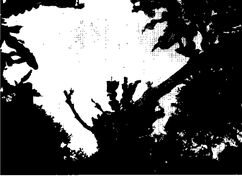
Fig. 5. — Les feuilles de Lophira deviennent vite coriaces et seules les extrémités sont arrachées.