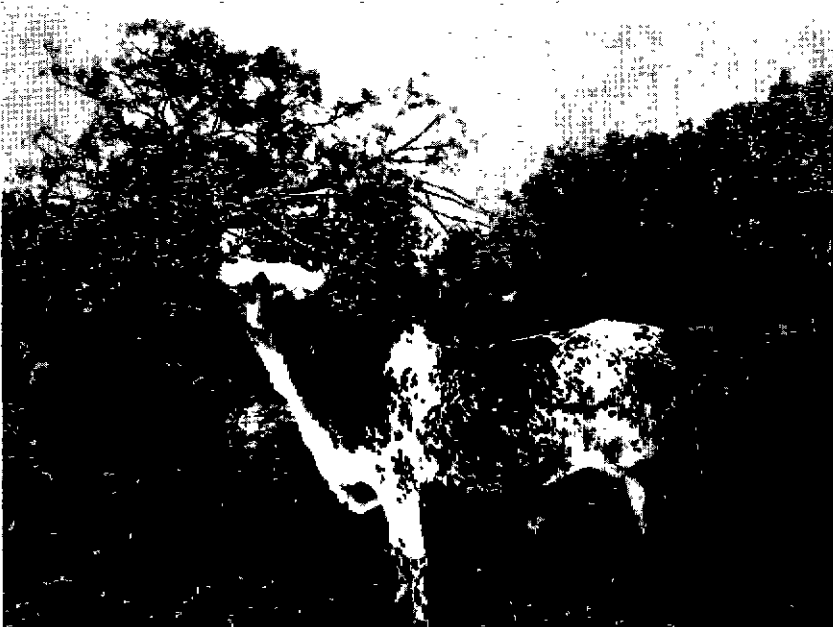
Fig. 6. — On se tordra le cou plus encore, mais tout ce que ce Lounea peut offrir sera prélevé.