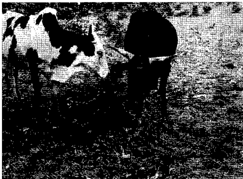
Fig. 7. — Sur cette savane assez riche en espèces ligneuses, le bétail n'a rien d'autre à exploiter. — Le tapis herbacé très ras en fin de saison des pluies a brûlé et le regain très modeste a disparu depuis longtemps.