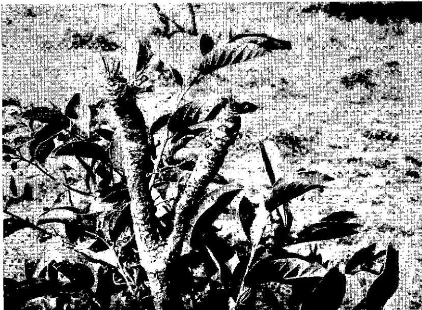
Fig. 4. — Ce jeune Cussonia ne fera pas une feuille intacte de toute la saison sèche l' Annona voisin restera intouché.