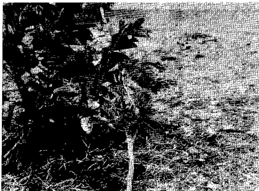
Fig. 8. — Peu de feuilles du Daniellia seront épargnées mais l' Annona derrière ne sera pas même effleuré.