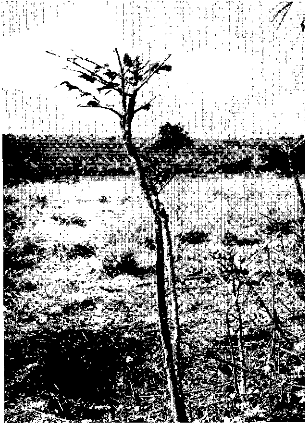
Fig. 3. — Ce jeune Fagara malgré ses épines est effeuillé et même écorcé, l'absence ou la faiblesse du feu lui permettra cependant de survivre.