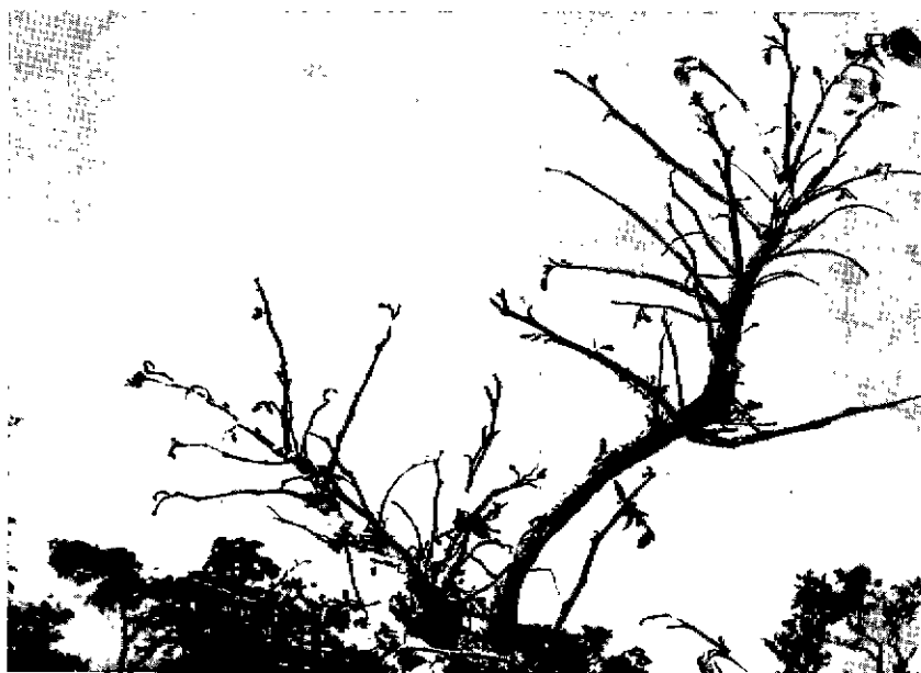
Fig. 2. — Rejet de Prinosigma .