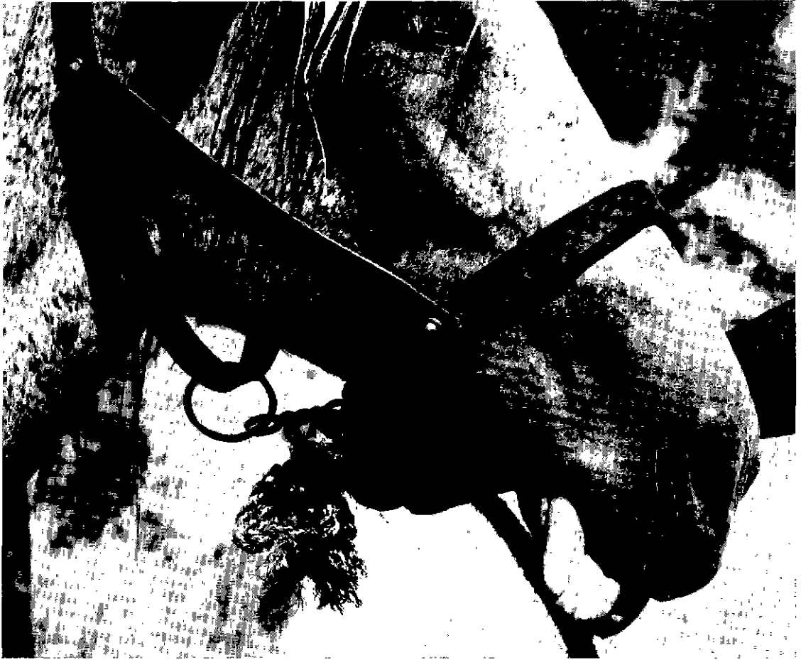
Photo 1. — Cheval atteint de botulisme avec paralysie de la langue et de la lèvre inférieure.

toxinoène dès le premier passage sur milieu artificiel solide (12, 13).