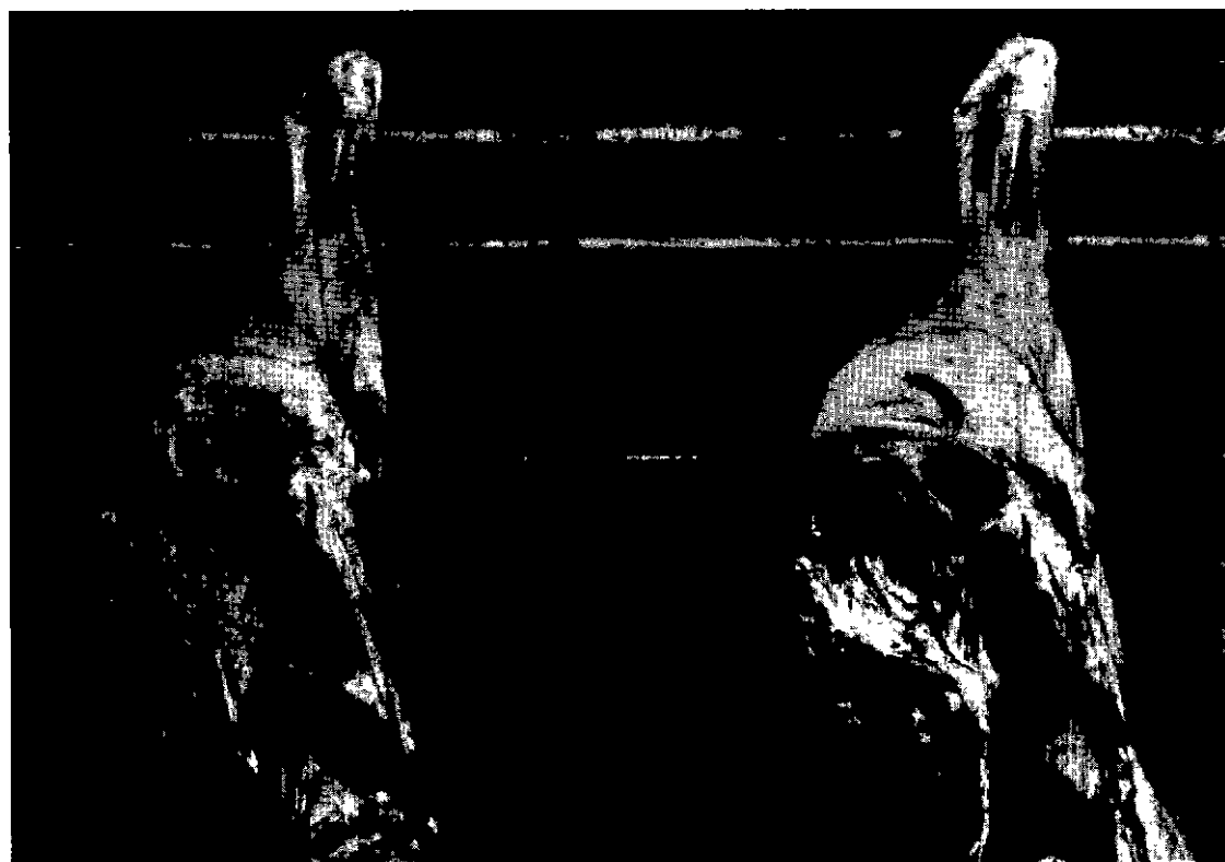
Photo 6. - Globes de taurillons 11 mois. De gauche à droite : gains minimal et maximal.