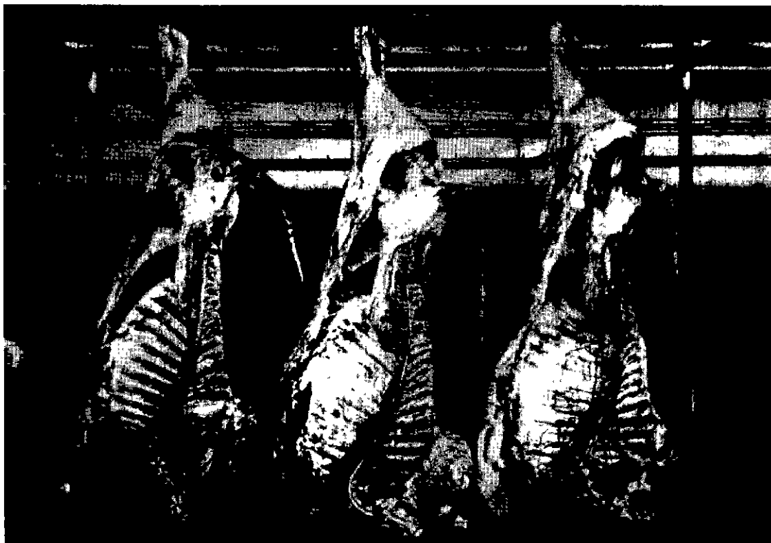
Photo 1. - Carcasses des taureaux. De gauche à droite : gains minimal, moyen et maximal.