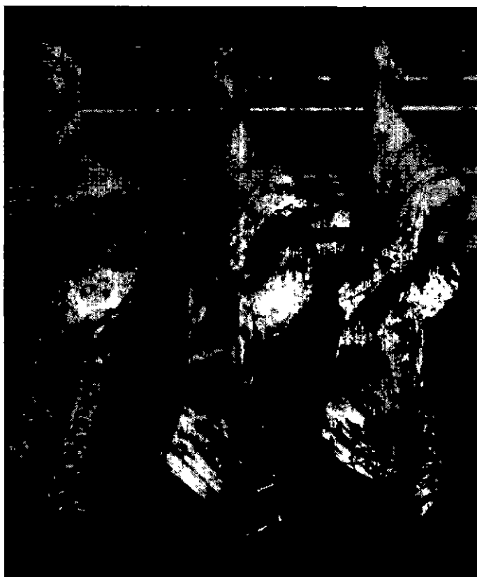
Photo 2. - Pans des taureaux. De gauche à droite : gains minimal, moyen et maximal.