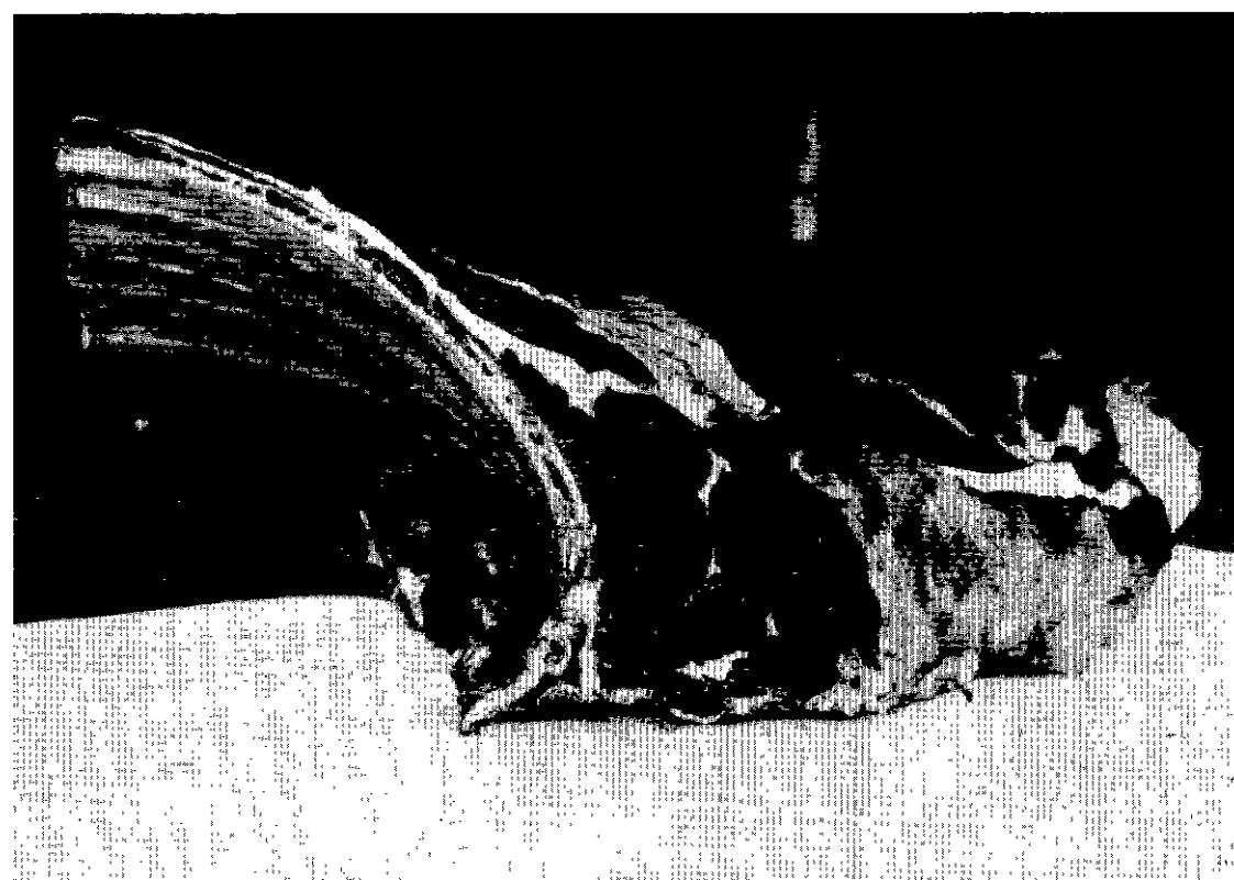
Photo 4. - Train de côtes taureau gain minimal; coupe au 9 e espace intercostal.