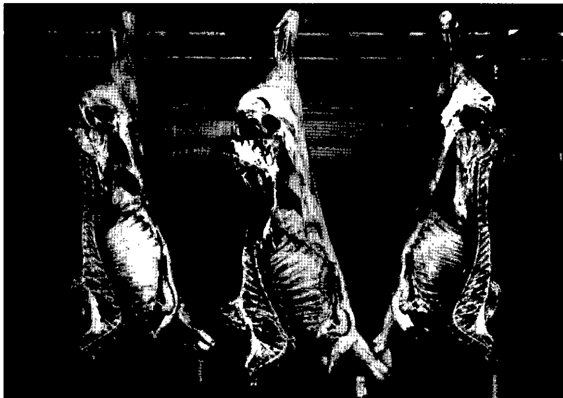
Photo 5. - Carcasses de taurillons 11 mois. De gauche à droite : gains minimal, maximal et moyen.