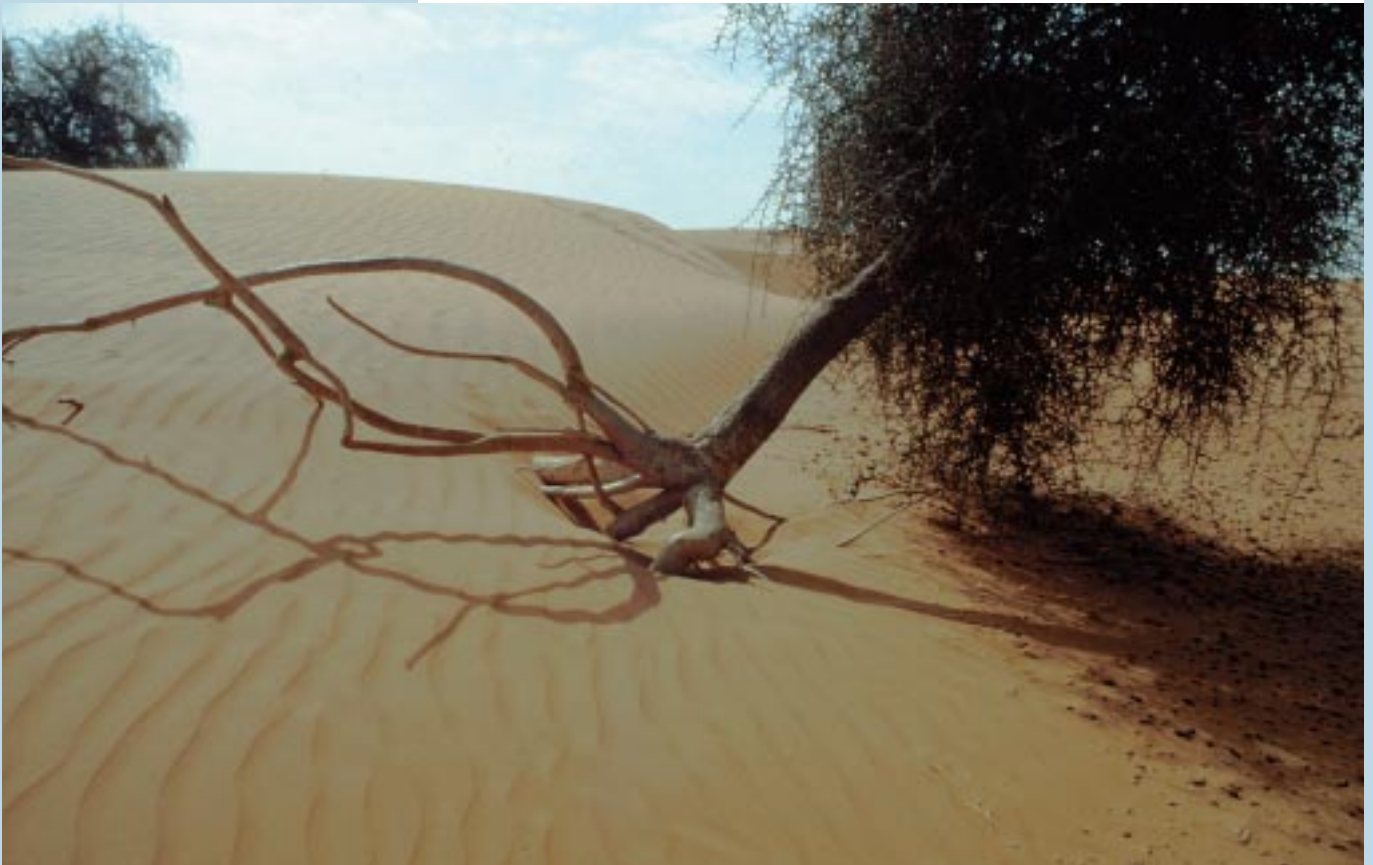
Photo 1. Désertification au Sahel : Balanites aegyptiaca déraciné par une dune vive. Desertification in the Sahel : Balanites aegyptiaca uprooted by a moving dune.

Quelles sont les recherches à mener pour mieux lutter contre la désertification ? Un projet de recherche analyse les processus de conservation et d'évolution de la diversité génétique des espèces forestières dans deux régions au nord et au sud du Sahara. Sa stratégie et ses méthodes sont détaillées.