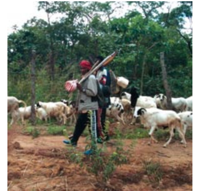
Bergers nomades peuls mbororos avec leurs moutons en République centrafricaine.