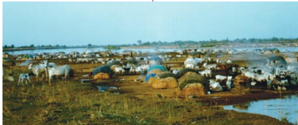
Campement d'éleveurs peuls au sud du Tchad.