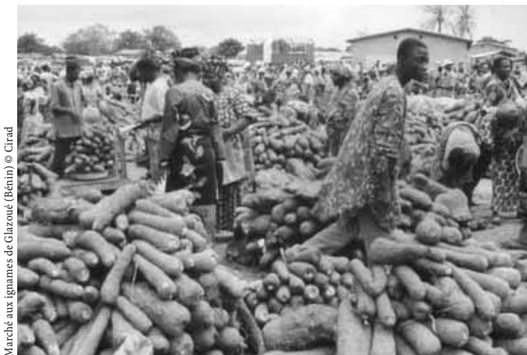
Marché aux ignames de Glazoué (Bénin)

« LES PRODUITS LOCAUX RESTENT TRÈS APPRÉCIÉS ET CONSOMMÉS EN VILLE »