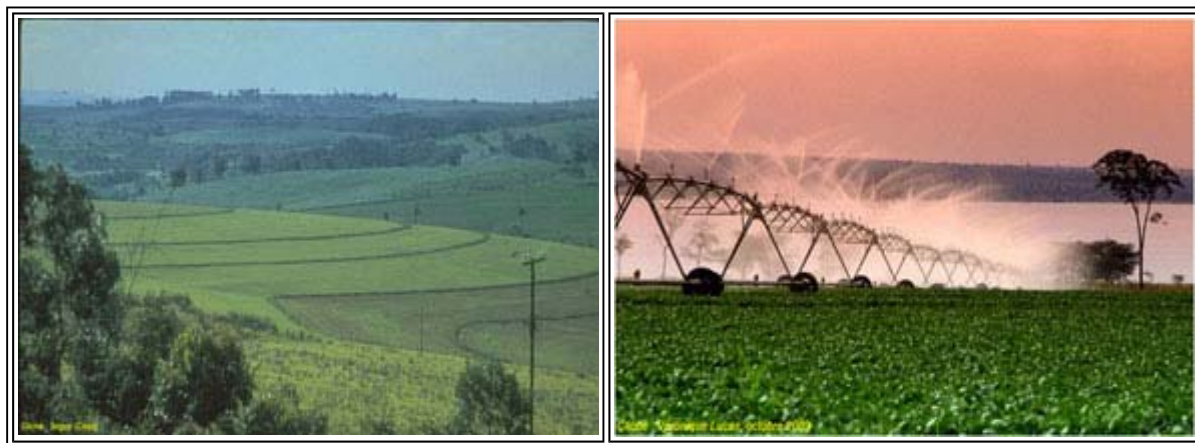
- À gauche : monoculture du soja (Mato Grosso). Cliché : Seguy (Cirad) - À droite : irrigation par pivot central à Petrolina (Pernambuco). Cliché : Véronique Lucas, octobre 2009

L'objectif de moderniser les rapports de production latifundia/minifundia était largement, consensuel. Leur disparition devait conduire à la création soit d'entreprises rurales (le latifundium se modernise en particulier par la mécanisation ; les travailleurs ruraux obtiennent un statut d'ouvrier agricole bien que la plupart d'entre eux émigrent vers les villes, le mouvement permettant l'industrialisation), soit d'une agriculture familiale (les travailleurs ruraux par le jeu de la réforme agraire ou du marché s'installent en tant que propriétaires). La promulgation d'un code du travail rural avec un statut du travailleur rural (loi n° 4214 de 1963), rend obligatoire, en particulier, le contrat de travail et met en œuvre un système de sécurité sociale. Les politiques ont aussi cherché à mettre en œuvre des instruments d'appui à l'utilisation de "paquets techniques" de manière indiscriminée pour les entreprises rurales et les agriculteurs familiaux (Weid et al, 2003).