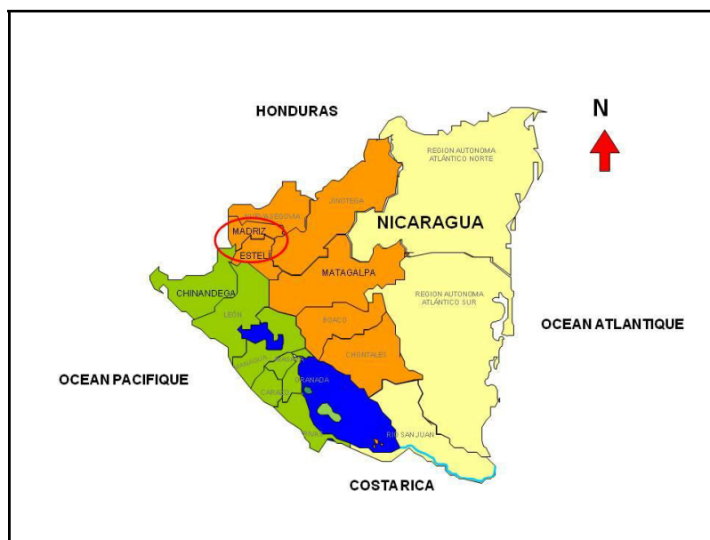
Carte 1. Zone d'intervention du projet sélection participative sorgho au Nicaragua

Dans cette zone, un premier diagnostic approfondi a fait ressortir une demande des agriculteurs pour l'amélioration de trois types de sorgho cultivés localement, les sorghos millón 1 , tortillero 2 et escoba 3 (Martínez Sanchez, 2002; Trouche et al., 2006). Le programme de recherche a ainsi commencé à travailler sur ces trois types, en utilisant l'approche de sélection variétale participative (en anglais Participatory Variety Selection-PVS), et en ayant recours à une large diversité de variétés et lignées existantes, notamment parmi celles développées par le Cirad et ses partenaires en Afrique de l'Ouest pour des écosystèmes similaires (climat semi-aride et sols de faible fertilité). Chemin faisant, les critères de sélection pour chaque type de sorgho ont pu être définis sur la base i) des contraintes et objectifs de production des systèmes de culture cible, ii) des observations des agriculteurs par rapport aux nouveaux types de plante évalués sur le terrain et iii) de la confrontation entre les phénotypes préférés et leurs performances agronomiques mesurées in situ . Dans ce cas, trois saisons de culture ont été nécessaires pour co-définir précisément les idéotypes variétaux. Cette approche PVS a fourni des résultats probants; elle a permis d'identifier et diffuser plusieurs variétés des types millón et tortillero, dont une, Blanco Tortillero, a été officiellement inscrite au catalogue variétal national (Trouche et al., 2008).