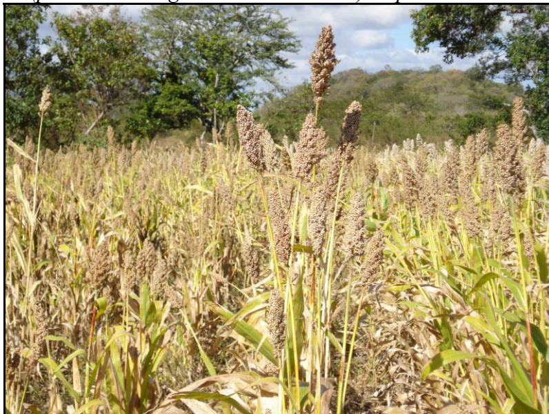
Photo 3. Parcelle de sélection des lignées PCR-2 sous gestion de rebrote à Unile (parcelle de Hugo Francisco Guillén) en postrera 2007.

Pour l'objectif de sélection correspondant au système de culture rebrote , les travaux de création de lignées, démarrés plus récemment, sont toujours en cours. Toutefois, l'évaluation préliminaire des lignées S_2 et S_3 durant le processus de création a montré qu'il était possible d'obtenir des lignées ayant des cycles bien calés par rapport aux deux saisons de culture, un type de plante adaptée à la culture associée, une bonne vigueur de rebrote , une productivité en grain supérieure à la meilleure variété témoin sur l'ensemble des deux cycles et des caractéristiques de type de plante et de grain appréciées par les agriculteurs (photo 3). La pratique du rebrote étant toutefois connue pour ses effets négatifs sur la fertilité des sols, ce travail de sélection est accompagné depuis 2007 par la conduite d'essais agronomiques visant à définir les meilleures pratiques combinant association sorgho-légumineuse (haricot commun, niébé et haricot mungo ) et amendements organiques pour maintenir la productivité du système.