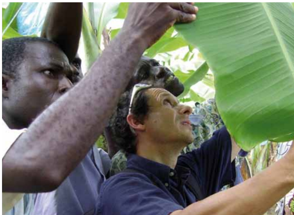
Observation de la Maladie des Raies Noires sur les feuilles de bananier