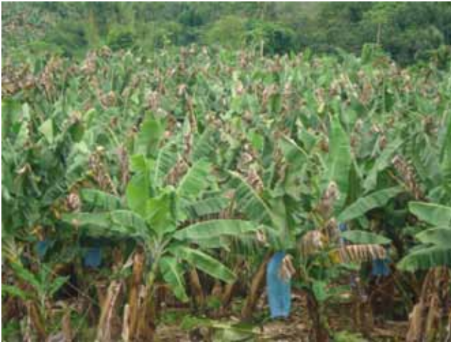
Dégâts foliaires causés par la cercosporiose noire dans une bananeraie commerciale.

Ces maladies provoquent des nécroses foliaires entraînant des pertes de rendement, mais elles sont avant tout responsables de la maturation précoce des fruits, ce qui les rend impropres à l'exportation. Ainsi, la lutte contre ces maladies est une question vitale pour toute la filière d'exportation. Cette lutte est exclusivement chimique. Dans les pays producteurs de bananes soumis à des conditions climatiques tropicales et humides, non seulement la lutte chimique a un coût élevé, mais la fréquence élevée des traitements a entraîné l'apparition de souches résistantes aux fongicides. De plus, l'impact des traitements répétés nuit à l'environnement et à la santé des ouvriers agricoles. La situation est dans une impasse technique, économique et environnementale et il est urgent de trouver des solutions alternatives à cette lutte chimique.