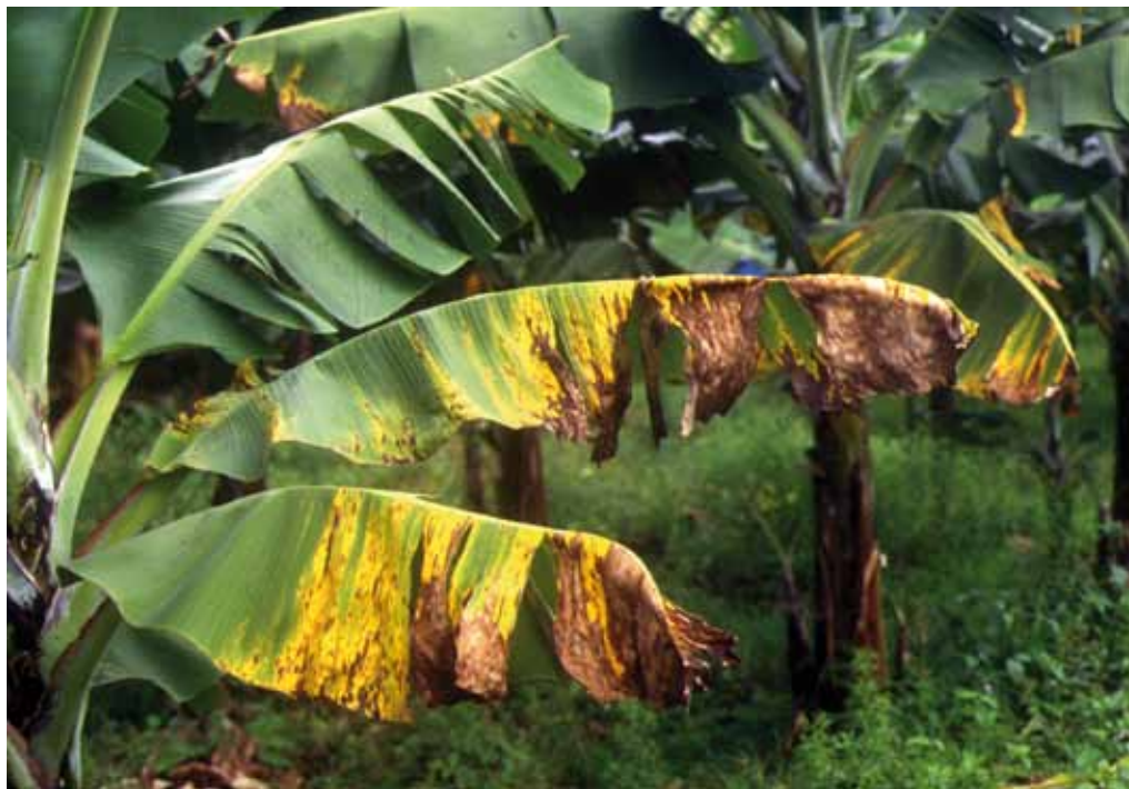
Feuilles atteintes par la cercosporiose.

La cercosporiose noire (Maladie des Raies Noires, MRN, causée par Mycosphaerella fijiensis ) et la cercosporiose jaune (Maladie de Sigatoka, MS, causée par Mycosphaerella musicola ) constituent deux contraintes majeures pour la production de bananes dessert destinées à l'exportation. Ces maladies foliaires menacent tous les pays producteurs de bananes dans le monde puisque la production de bananes destinées à l'exportation repose sur l'utilisation de cultivars (Cavendish) qui sont très sensibles à ces maladies. M. fijiensis , qui est plus agressif que M. musicola , a connu une expansion rapide dans les différents pays producteurs de bananes où il a progressivement remplacé M. Musicola . Aujourd'hui, quasiment tous les pays producteurs de bananes sont touchés par la cercosporiose noire, à l'exception de quelques îles dans les Caraïbes où M. fijiensis n'est pas encore présent, et des Iles Canaries, où la pluviométrie très faible empêche le développement de ces champignons pathogènes.