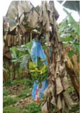
Principale conséquence des cercosporioses des bananiers : maturation précoce des fruits qui rend la production impropre à l'exportation.