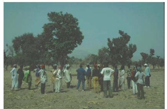
Tour du territoire de Mafa Kilda (Cameroun)

Cela permet d'avoir une première appréhension de l'étendue du territoire et de sa diversité, de se faire une idée, à travers l'analyse des paysages que l'on découvre, des modes d'exploitation des ressources, des systèmes agro-sylvo-pastoraux, et des interactions possibles avec des communautés voisines ou les acteurs extérieurs. Cela permet aussi de commencer à réfléchir à l'application concrète de la démarche d'inventaire et d'enquêtes.