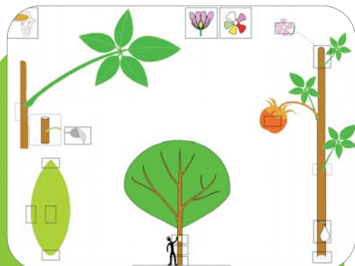
Profil d'identification d'un baobab.

Le Cirad attache une grande importance à la reconnaissance des espèces et à la connaissance de leurs usages. Voici quelques exemples.