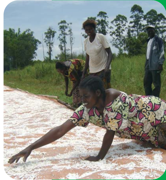
Récolte de manioc après culture sur brûlis de plantation d'acacia et transformation en cossettes.

Cependant, d'autres systèmes agroforestiers méritent d'être testés dans d'autres conditions écologiques et socio-économiques, par exemple en gérant le recru naturel d'espèces locales à usages multiples (fruits, bois, abri d'animaux comestibles, fixation d'azote, etc.). En effet, sur les terrains plus argileux autrefois occupés par la forêt, il existe une grande variété d'espèces arborées dans le recru naturel. Ces arbres ne peuvent pas se développer en raison des coupes incessantes et du passage incontrôlé des feux. Si la parcelle est couverte d'un fourré, l'agriculteur pourra d'abord la protéger par un pare-feu puis sélectionner 100 à 400 brins par hectare d'espèces utiles parmi les milliers de repousses. Ensuite, il pourra exploiter la parcelle pour y récolter du bois de feu, tout en conservant quelques grands arbres semenciers (10 à 100 par hectare), et mettre en place des cultures.