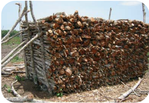
Des charbonniers de plus en plus performants.

A une centaine de km à l'Est de Kinshasa, la plantation de Mampu a été conçue comme la phase pilote d'un vaste projet de reboisement de 100 000 hectares sur les sols sableux du plateau Batéké. Huit mille hectares d' Acacia auriculiformis ont été plantés entre 1987 et 1993. A partir de 1994, la plantation de Mampu a été divisée en lots de 25 hectares attribués à 320 familles d'agriculteurs. Ceux-ci doivent gérer leur plantation en suivant une technique agroforestière innovante qui associe la culture de produits vivriers avec celle de l'acacia. Après les récoltes des produits agricoles, les acacias atteignent 3 mètres de hauteur. Après une dizaine d'années, c'est une véritable forêt d'acacias, mélangée à quelques espèces locales, qui s'est installée. L'agriculteur peut alors l'exploiter, transformer le bois en charbon et le vendre en ville. Dans l'humus non détruit, il pourra replanter un nouveau cycle de culture. Une bande de sol sera conservée non cultivée pour que les graines d'acacia y germent et reconstituent le futur peuplement forestier.