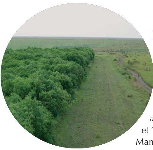
Boisement de savane dégradée, principalement à l'aide d' Acacia auriculiformis .

A une centaine de km à l'Est de Kinshasa, la plantation de Mampu a été conçue comme la phase pilote d'un vaste projet de reboisement de 100 000 hectares sur les sols sableux du plateau Batéké. Huit mille hectares d' Acacia auriculiformis ont été plantés entre 1987 et 1993. A partir de 1994, la plantation de Mampu a été divisée en lots de 25 hectares attribués à 320 familles d'agriculteurs. Ceux-ci doivent gérer leur plantation en suivant une technique agroforestière innovante qui associe la culture de produits vivriers avec celle de l'acacia. Après les récoltes des produits agricoles, les acacias atteignent 3 mètres de hauteur. Après une dizaine d'années, c'est une véritable forêt d'acacias, mélangée à quelques espèces locales, qui s'est installée. L'agriculteur peut alors l'exploiter, transformer le bois en charbon et le vendre en ville. Dans l'humus non détruit, il pourra replanter un nouveau cycle de culture. Une bande de sol sera conservée non cultivée pour que les graines d'acacia y germent et reconstituent le futur peuplement forestier.