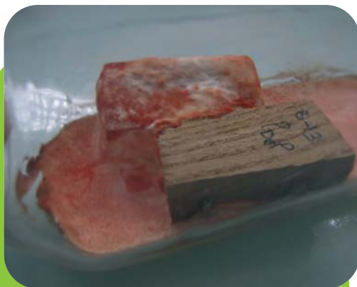
Essai de résistance naturelle du bois de mûrier au champignon tropical Pycnoporus sanguineus .