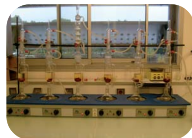
Extraction de métabolites secondaires du bois à l'aide d'un appareil de Soxhlet.

Une très large gamme d'espèces naturellement durables reste encore à étudier afin de déterminer les potentialités de valorisation de leurs composés extractibles.