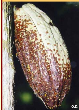
Daños por chinche (o Monalotion)