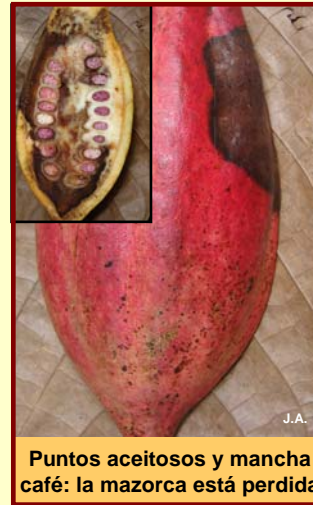
Puntos aceitosos y mancha café: la mazorca está perdida