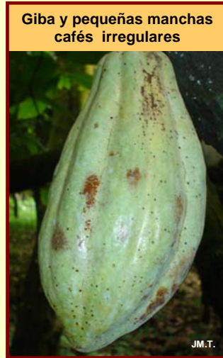
Giba y pequeñas manchas café irregulares