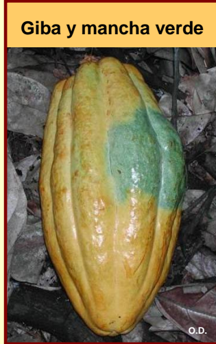
Giba y mancha verde