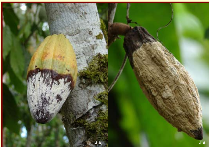
La mancha café se vuelve blanca y después crema: la monilia se multiplica

Son llevadas por el viento, los animales o cualquier persona.