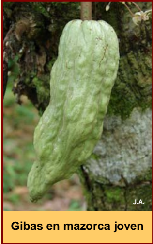
Gibas en mazorca joven