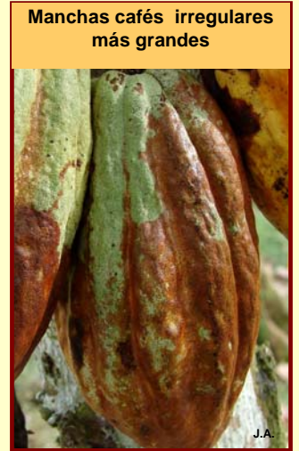
Manchas café irregulares más grandes

Este polvo son las semillas de la Monilia y son muy contagiosas para las mazorcas sanas.