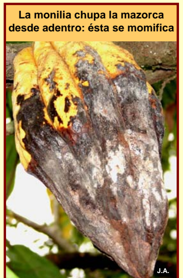
La monilia chupa la mazorca desde adentro: ésta se momifica