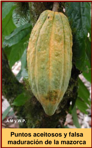
Puntos aceitosos y falsa maduración de la mazorca

Si no la corta, la mazorca con Monilia se cubre con un polvo blanco o crema