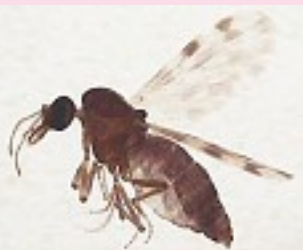
Figure. Femelle de Culicoides imicola , principal vecteur du virus de la FCO en Afrique, Proche et Moyen-Orient et dans le bassin méditerranéen

Le genre Culicoides comporte plus de 1 300 espèces, dont 84 sont présentes en France. Les adultes sont de petits diptères piqueurs de 1 à 4 mm. Seules les femelles sont hématophages et certaines espèces sont très agressives. Les préférences trophiques varient selon les espèces (mammophiles ou ornithophiles, rarement animaux à sang-froid). Leur dispersion active serait faible, mais ils pourraient être transportés passivement sur de longues distances par le vent. Leur longévité serait de 10 à 20 jours (exceptionnellement 60 à 90 jours à basse température). Les œufs éclosent 2 à 8 jours après la ponte. Ils sont pondus sur sol humide riche en matières organiques d'origine végétale en décomposition (trous d'arbres, souches pourries, feuilles mortes, etc.) ou recyclées par les animaux (bouses, crottins, etc.). Le développement larvaire (4 stades) peut durer de 2 semaines l'été à plusieurs mois l'hiver. Ensuite, la larve se transforme en nymphe, d'où, après 2 à 10 jours, émerge l'imago.