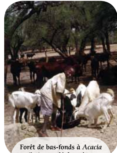
Forêt de bas-fonds à Acacia nilotica , « clé de voûte » du système d'élevage d'une vallée nigérienne, menacée par les défrichements agricoles incontrôlés.

Les forêts ripicoles et de bas-fonds sont souvent défrichées pour installer des cultures maraîchères ou de décrue, des vergers fruitiers ou des plantations d'arbres, qui privent le bétail d'accès aux points d'eau au coeur de la saison sèche, voire les assèchent. Cette intensification des zones fertiles et irrigables peut être légitime pour les agriculteurs, mais les autorités traditionnelles, administratives et politiques doivent aussi tenir compte de la valeur irremplaçable de ces formations végétales uniques et de leur rôle de « clé de voûte » pour la faune sauvage et pour le bétail.