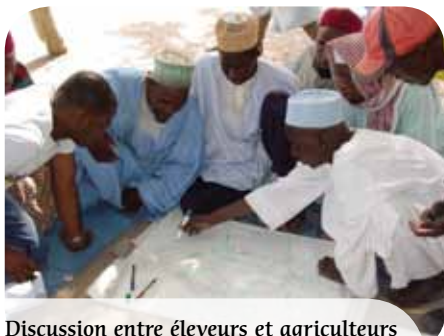
Discussion entre éleveurs et agriculteurs concernant la gestion commune du territoire dans un village du Nord-Cameroun.

Certains éleveurs se fixent partiellement et s'adonnent à l'agriculture. Dans le même temps, les agriculteurs acquièrent du bétail et revendiquent de plus en plus la propriété exclusive de leurs parcelles se réservant, notamment dans les régions densément peuplées, les chaumes et les produits des arbres pour leur propres animaux. Mais il existe encore des régions où les agriculteurs possèdent peu de bétail et des espaces agrosylvopastoraux restent sous-utilisés par l'élevage. Les arbres non émondés peuvent en outre y devenir gênants pour les cultures et être exploités. Il apparaît donc indispensable de préconiser le plus largement possible