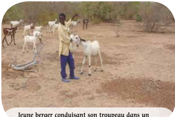
Jeune berger conduisant son troupeau dans un massif forestier aménagé pour la production de bois de feu au Niger.

Autrefois, la végétation naturelle des paysages sahéliens était constituée de savane arborée sur les reliefs et de différents types de forêts dans les vallées. Aujourd'hui, dans toutes les zones peuplées, la plupart des sols profonds ont été défrichés et mis en culture. La cohabitation des agriculteurs et d'autres usagers de ces espaces (éleveurs notamment), avec des intérêts parfois antagonistes, peut être source de conflits. Les chercheurs du Cirad, à travers différents projets, montrent que ces groupes peuvent s'organiser et trouver des solutions d'aménagement de l'espace qui optimisent les synergies.