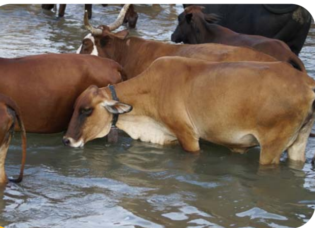
Vaches au point d'eau, lieu de rencontre entre animaux sauvages et domestiques en saison sèche, Zimbabwe.

A u cours des 60 dernières années, parmi les 300 maladies infectieuses qui ont émergé chez l'homme, plus de 40 % avaient pour origine un animal sauvage : SRAS, Ebola, influenza aviaire, etc. A l'inverse, la crise de la biodiversité que nous traversons est en partie due à l'émergence de maladies qui ont pour origine des animaux domestiques ou l'homme. Du fait des changements globaux (démographie, climat, emprise agricole croissante, mondialisation des échanges...), les contacts entre la faune, le bétail et l'homme sont amenés