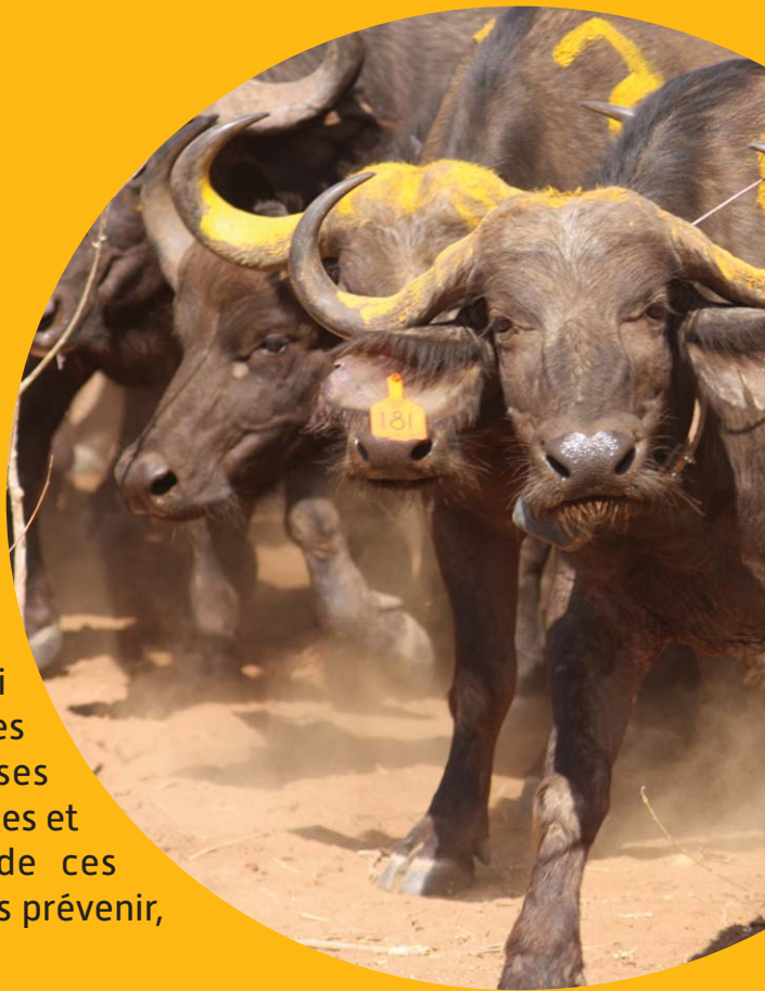
Buffles marqués et équipés d'un collier GPS au Zimbabwe.

Comment anticiper et prévenir les risques sanitaires liés aux interactions entre la faune sauvage, les animaux domestiques et les hommes qui vivent au contact de ces animaux ? La faune sauvage héberge en effet des maladies qui présentent un risque pour la santé humaine et celle des animaux domestiques. Le rôle du Cirad et de ses partenaires est de comprendre les processus écologiques et anthropiques qui conditionnent la transmission de ces maladies, afin de proposer des solutions pour mieux les prévenir, les surveiller et les contrôler.