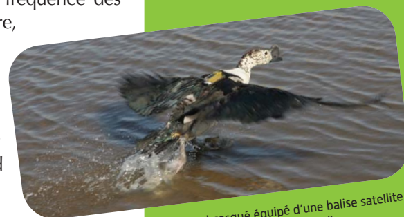
Canard casqué équipé d'une balise satellite dans le delta du Niger au Mali.