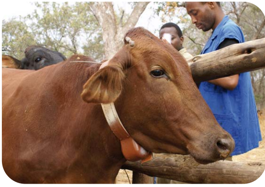
Vache équipée d'un collier GPS, dans un village situé en périphérie du parc de Gonarezhou au Zimbabwe.