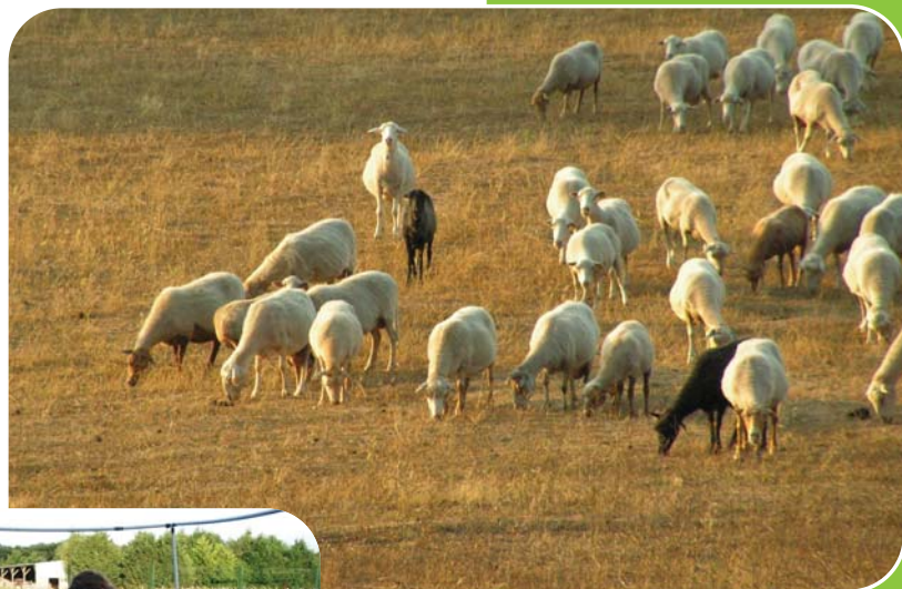
Troupeau de moutons en Corse.