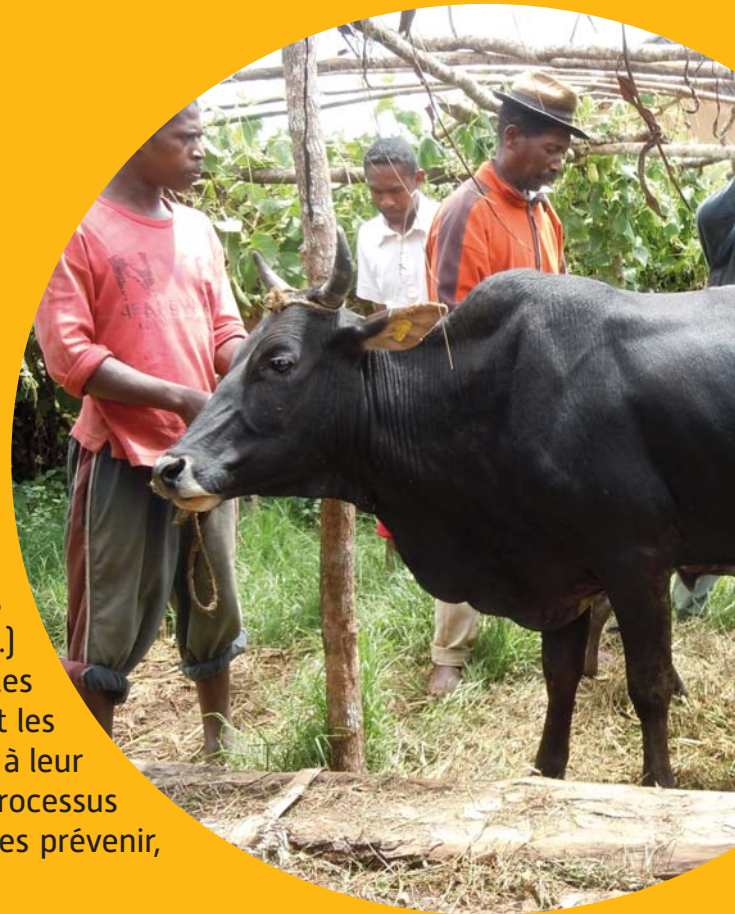
Contention d'un zébu avant prélèvement sanguin, Madagascar.

Entre 1990 et 2000, près du quart des 300 maladies ayant émergé chez l'homme étaient des maladies vectorielles. Transmises par des arthropodes tels que les insectes (moustiques, moucheron, punaises...) ou les acariens (tiques, puces...), les maladies vectorielles sont particulièrement sensibles à leur environnement, et les modifications de cet environnement peuvent contribuer à leur émergence. Le rôle du Cirad est de comprendre les processus biologiques en jeu afin de proposer des solutions pour les prévenir, les surveiller et les contrôler.