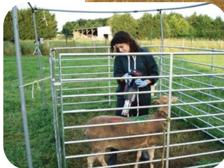
Aspiration directe de Culicoides sur un mouton pour évaluer le taux de piqûre.

L'approche par modélisation a permis de montrer que le climat des vingt dernières années a favorisé l'émergence de la maladie, selon des mécanismes différents dans le sud et le nord de l'Europe. Dans le sud de l'Europe, le climat a favorisé l'extension et l'augmentation des populations du vecteur afro-asiatique Culicoides imicola , alors que dans le nord, le climat a raccourci le cycle du virus au sein du vecteur et augmenté le taux de piqûre journalier des Culicoides autochtones. Cette approche est aussi utilisée pour simuler l'évolution future du risque de transmission dans l'espace et dans le temps et l'incertitude associée à ces simulations.