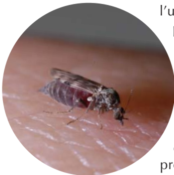
Femelle Culicoides nubeculosus gorgée de sang.

En collaboration avec les climatologues et épidémiologistes de l'université de Liverpool, le Cirad a développé une approche permettant d'évaluer l'effet des modifications passées et futures du climat sur le risque de transmission d'une maladie infectieuse. Cette approche a été appliquée à la fièvre catarrhale ovine (FCO), maladie virale des ruminants transmise par certains moucheron du genre Culicoides . La FCO, considérée comme une maladie tropicale exotique jusqu'en 1998, a provoqué ensuite une des épizooties les plus massives que l'Europe a connue (plus de 110 000 foyers dans 14 pays).