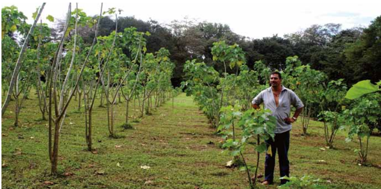
Plantación de Jatropha curcas de un año de edad en Guanacaste, Costa Rica

(Sinaloa y Michoacán), el sur del país (Chiapas) y Yucatán (Aguillón 2008). México tiene entre 3070 y 6500 ha plantadas con jatrofa (GEXSI 2008).