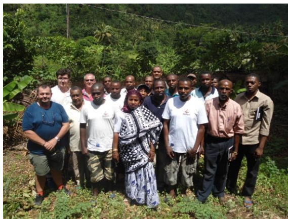
Participants à la formation sur l'utilisation de produits phytosanitaires

En parallèle de la formation, nous avons pu visiter deux boutiques de vente de produits phytosanitaires, à Pomoni et Salamani. Dans les deux cas, il a été constaté des lacunes graves en matière de conservation et de manipulation de produits phytosanitaires. Actuellement, la commercialisation des produits phyto dans ces boutiques est sous la responsabilité de l'ONG. Compte tenu des constatations faites et des risques encourus lors de l'utilisation de produits phytosanitaires nous recommandons vivement à l'ONG Dahari de ne plus assumer la responsabilité de la commercialisation de ces produits . Nous sommes parfaitement conscients de l'intérêt de cette action conduite par l'ONG pour les agriculteurs d'Anjouan et des efforts faits pour limiter au maximum le risque d'accident (usage de caisse bois, isolement des produits et des locaux) mais ce risque reste beaucoup trop élevé et pourrait être réellement préjudiciable à l'ONG en cas d'accident.