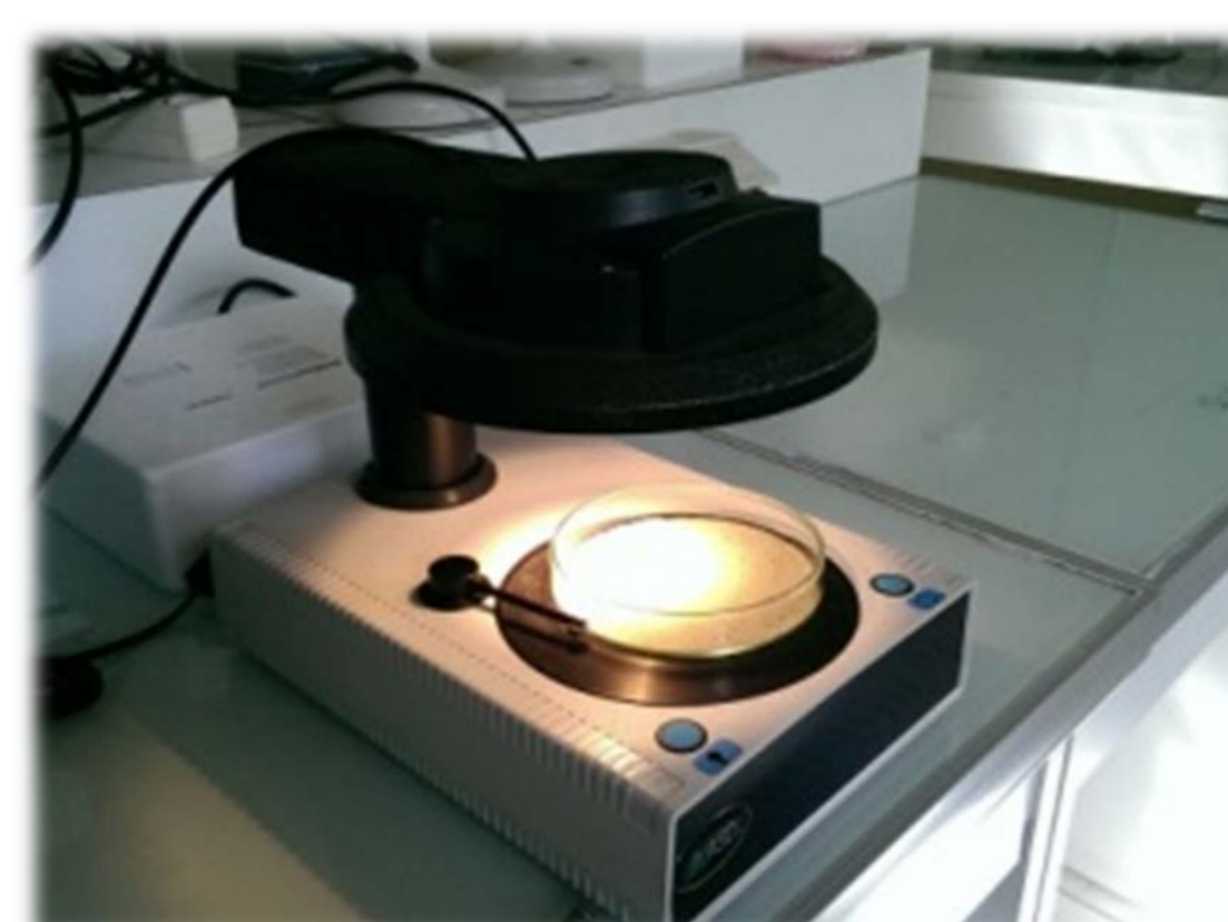
Cellule SPIR

Un approfondissement des méthodes fondées sur le dosage du Silicium et sur les propriétés granulométriques en milieu liquide est attendu pour la fin de l'année 2014.