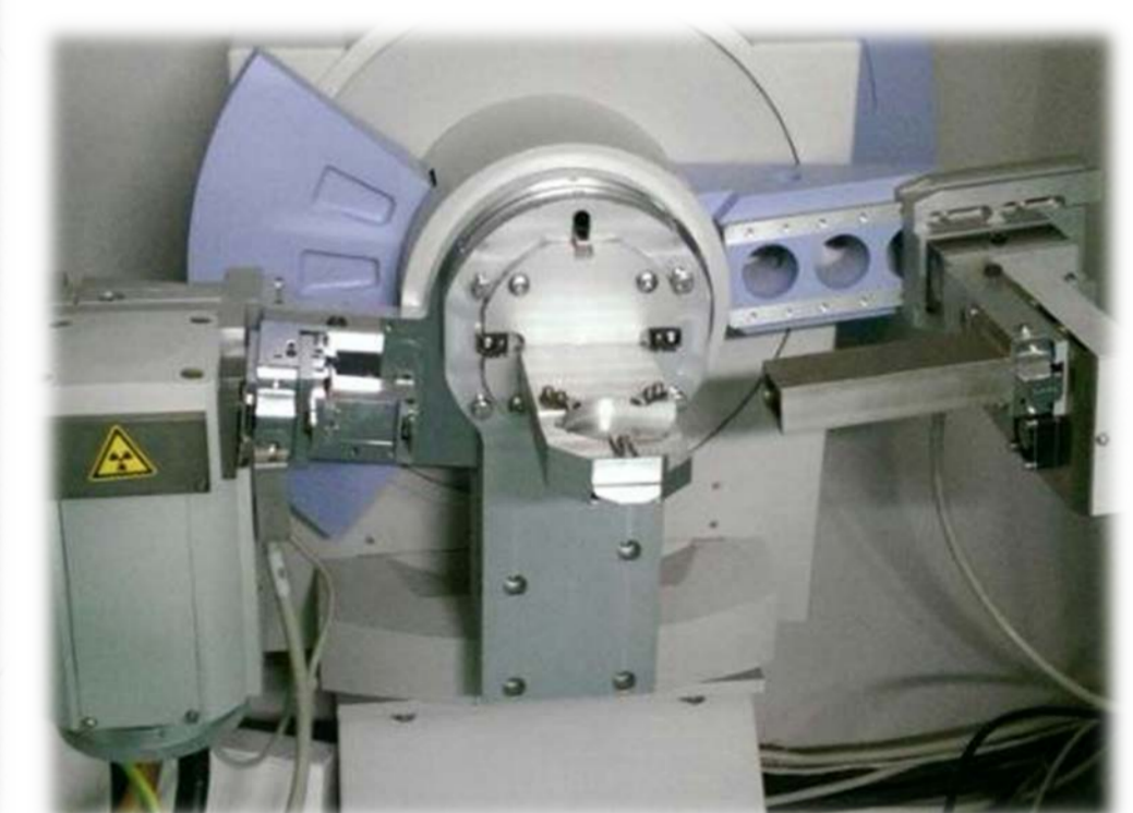
Diffraction Rayons X