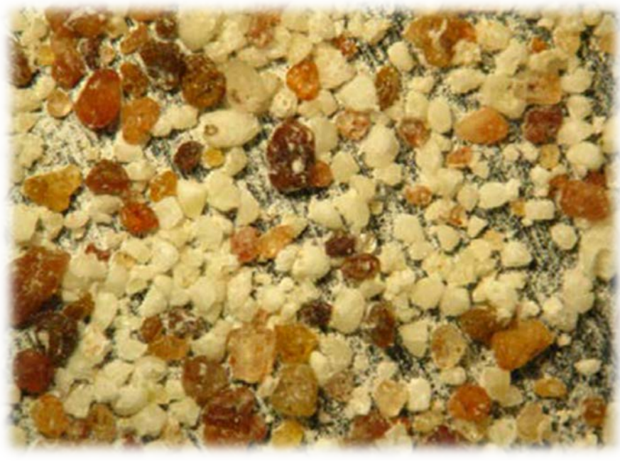
Sable dans les rebuts de dessablage traditionnel

(1) Cirad, Montpellier, France ; (2) IER/LTA, Bamako, Mali ; (3) IEM, Montpellier, France.