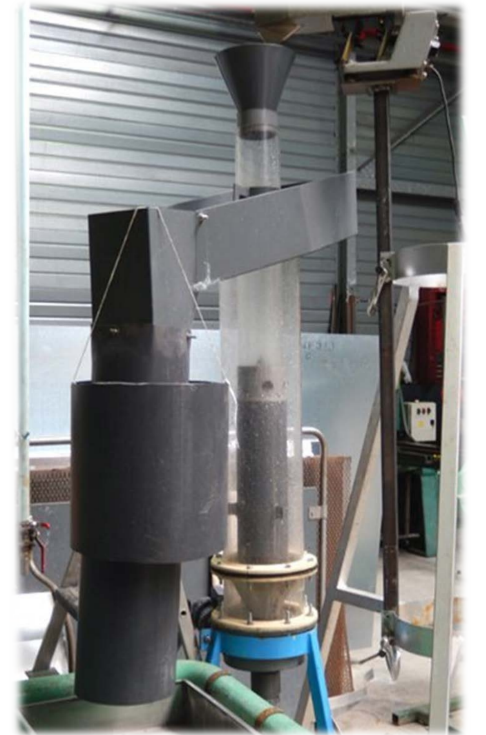
Dessableur Hydrolift