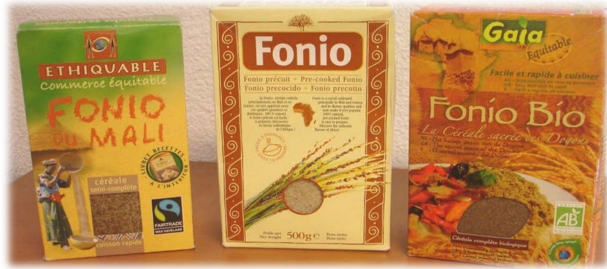
Fonio précuit export

Le fonio ( Digitaria exilis Stapf) est une céréale africaine très appréciée en Afrique de l'Ouest pour ses qualités culinaires et ses vertus diététiques. Son développement sur les marchés locaux et à l'export est freiné par la pénibilité des opérations post récolte, notamment en relation avec la petitesse de ses grains (1 mm). Le projet Aval Fonio (UA UE-Europe Aid) associe actuellement le Cirad à ses partenaires africains comme l'IRAG en Guinée, l'IER au Mali, l'IRSAT au Burkina Faso, l'ESP-UCAD au Sénégal dans la recherche d'amélioration de ces technologies post-récolte. Parmi les procédés étudiés, le dessablage fait l'objet d'une attention particulière, car il est très délicat d'éliminer le sable qui peut accompagner le produit tout au long de la chaîne malgré les soins pris pas les opératrices. L'opération de dessablage traditionnel est efficace mais très fastidieuse et consommatrice d'eau. La mise au point de procédés de dessablage améliorés nécessite de disposer d'une méthode objective de détermination de la teneur en sable.