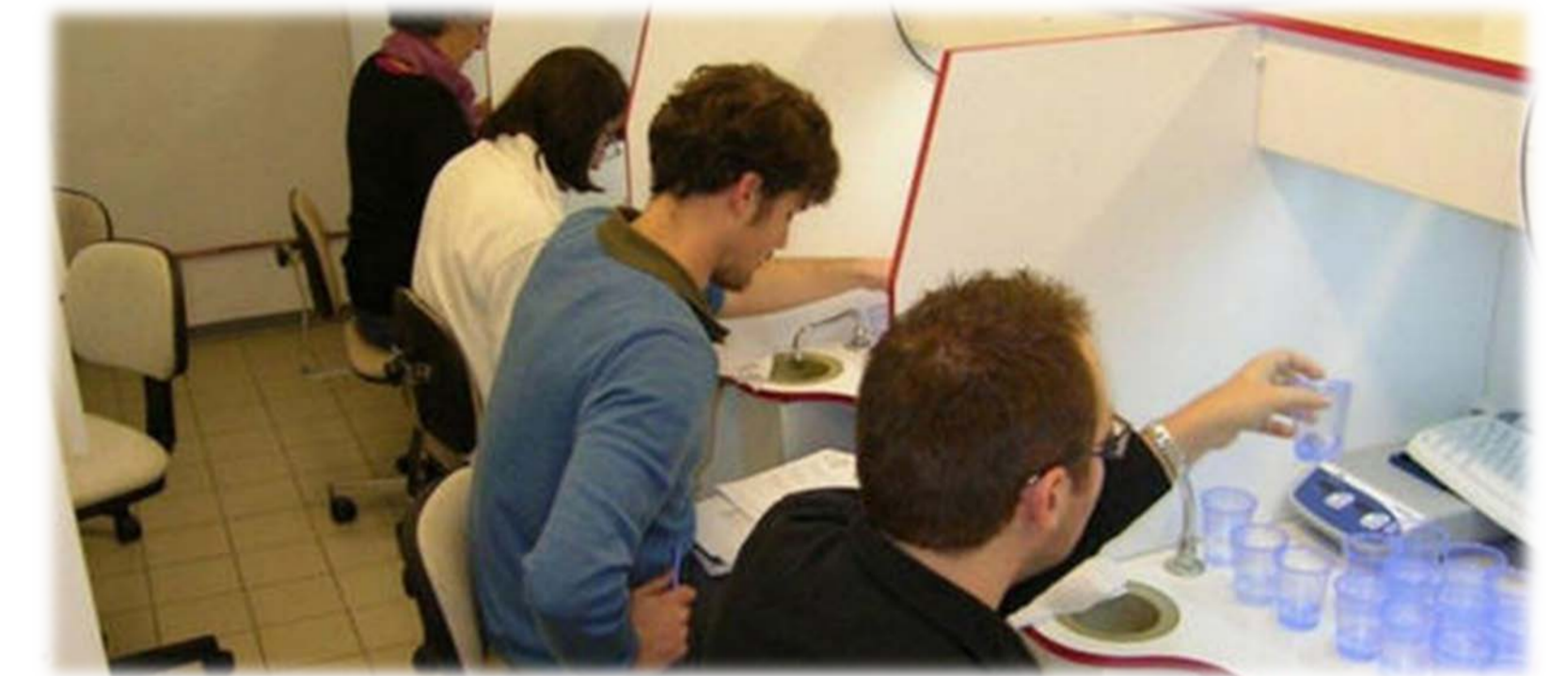
Analyse sensorielle

Une méthode sensorielle quantitative basée sur la détection du sable par mastication a également été testée. Cette dernière a permis de mettre en évidence sur des fonios précuits pour le marché local et l'export des teneurs en sable très faibles pondéralement, (< 0,01% poids/poids sur fonio sec), mais représentant toutefois une quantité résiduelle de 120 (+/-35) grains de sable par kilo. Cette méthode est très sensible mais compte-tenu de la pénibilité de la dégustation, elle ne permet pas d'évaluer des teneurs supérieures à 0,02%. Les études par diffraction des rayons X ont montré que les grains de sable sont constitués d'amas de 2 à 5 gros cristaux de silice. Toutefois cette configuration ne permet pas la quantification cette technique d'analyse.