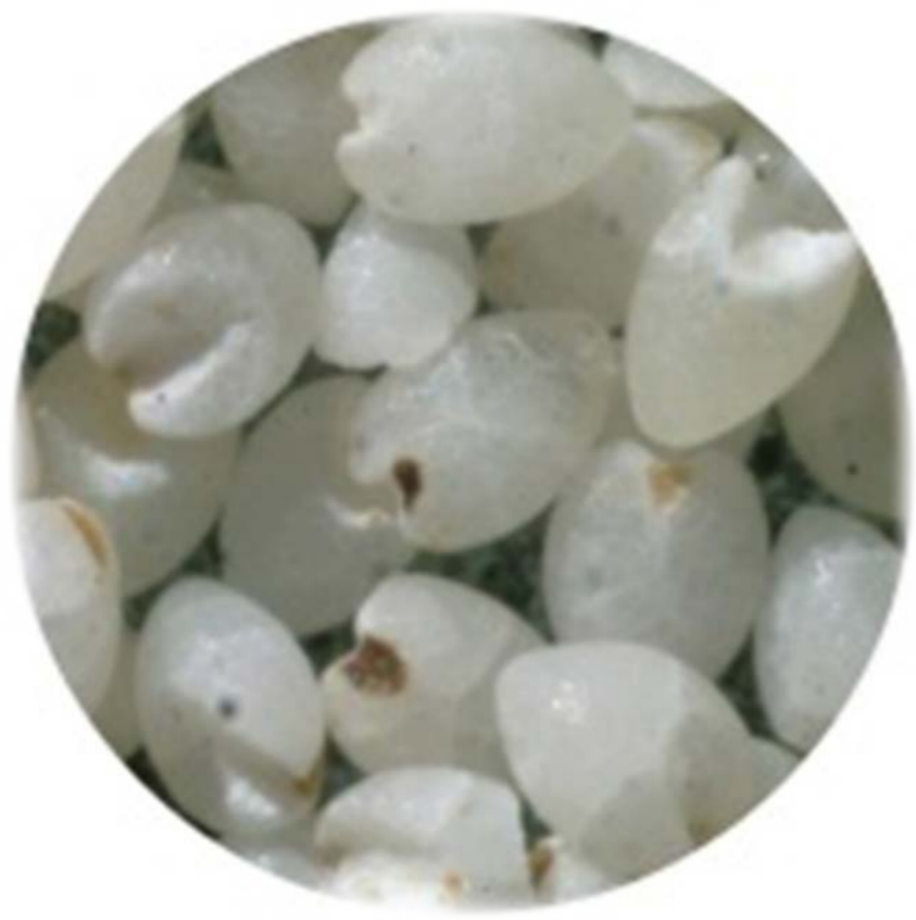
Fonio blanchi