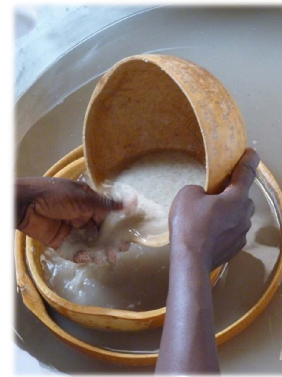
Dessablage traditionnel du fonio

La teneur en sable dans le produit décortiqué et lavé est de l'ordre de 3% (poids/poids, rapportée au fonio sec). Pour dessabler le fonio, des maquettes et des prototypes, comme l'Hydrolift, mettant à profit les différences de vitesse de flottation du sable et du fonio dans un flux d'eau sont à l'étude actuellement.