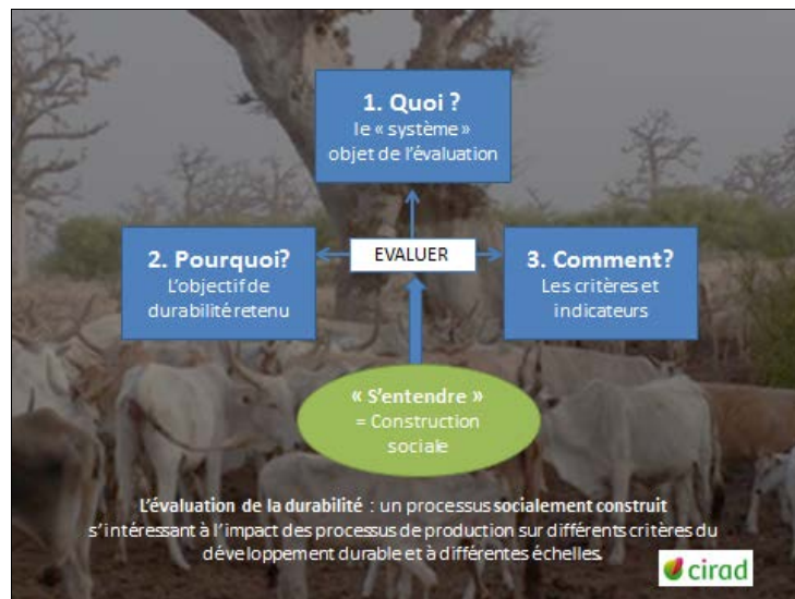
Figure 1 : schéma de la démarche d'évaluation

permet finalement de recenser l'ensemble des processus biophysiques impliqués en amont et en aval de l'activité de production. Ces approches environnementales sont mises en œuvre à plusieurs échelles : parcelle, territoire, planète..., mais leur caractéristique est de raisonner en système « ouvert », c'est-à-dire en considérant les liens entre le système étudié et l'extérieur de ce système.