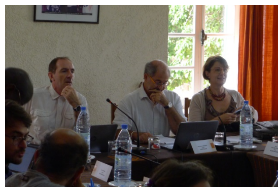
...et de la dernière session