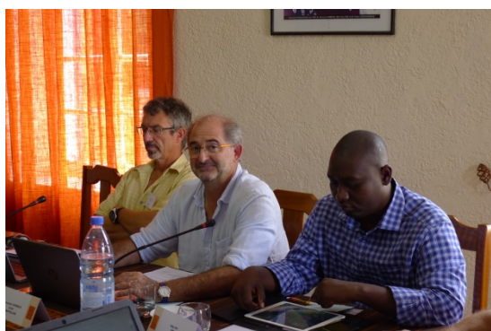
Les modérateurs de la première...

Elle a remercié l'ensemble des participants, ainsi que les formateurs et les organisateurs de la formation. Elle a insisté aussi sur l'importance de la thématique abordée dans la formation, et sur les enjeux pour les recherches futures.