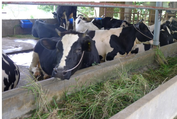
Photo 1 : L'évaluation de la durabilité des activités d'élevage : un travail à mener en premier lieu au niveau ferme

La réponse à ces questions nécessite de s'entendre sur la définition de l'adjectif « durable », et sur la manière de le mesurer. C'est-à-dire qu'il s'agit de s'entendre sur les termes de l'évaluation.