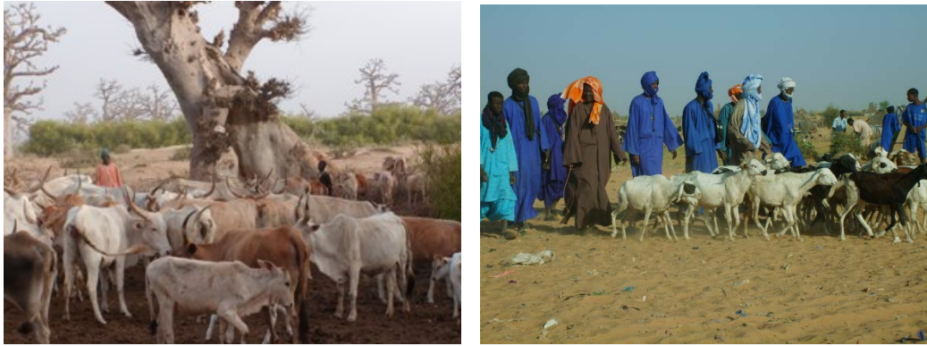
Photo 3 : L'élevage pastoral contribue à la durabilité des territoires agro-sylvo-pastoraux. Un des enjeux des recherches sur l'élevage est de quantifier cette contribution par l'identification d'indicateurs économiques, sociaux et environnementaux pertinents.

Enfin, le quatrième élément central de l'évaluation tient au processus de « choix collectif » des termes de l'évaluation. Comment les protagonistes de l'évaluation « s'entendent » sur la démarche choisie, et avec quels acteurs de terrain ou décideurs politiques les « stakeholders » ? Comment l'évaluation procède d'une construction sociale, c'est-à-dire de négociations, de rapports de force, de visions, ou même d'un projet politique (au sens du « collectif » qu'il soit national, international, ou territorial) ? Finalement, à quelles questions spécifiques répond l'évaluation ?