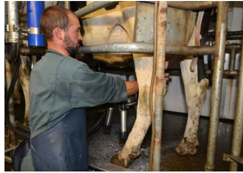
Photo 2 : Le travail d'évaluation contribue à mettre en balance les impacts de l'élevage sur l'environnement et sur la société à différentes échelles : troupeau, ferme, filière, territoire, planète.

En deuxième lieu, l'évaluation doit déterminer les objectifs de durabilité qui sont pris en compte. S'agit-il de considérer le caractère durable du système choisi ? On peut alors parler d'exploitation durable, ou de « système durable », et pourquoi pas « d'élevage durable » 1 . Ou bien, s'agit-il d'évaluer l'impact de ces systèmes sur le développement durable 2 ? Et si oui, de quel développement durable parle-t-on : du développement durable d'un territoire particulier ? Du développement durable d'une production particulière (le développement durable de la production porcine par exemple) ? Du développement durable de la planète ?