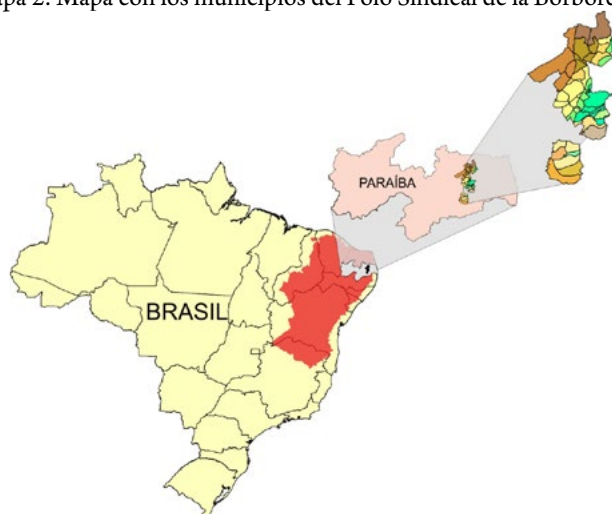
Mapa 2: Mapa con los municipios del Polo Sindical de la Borborema.