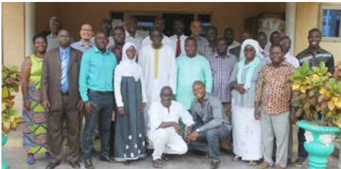
Participants à l'école régionale WABEF à Songhaï en juillet 2017. Le développement d'une masse critique de spécialistes du biogaz et des sujets connexes est essentiel au développement en Afrique de l'Ouest. Cela nécessite l'élaboration et la diffusion de programmes d'études, y compris des outils d'aide à la décision pour la formation de techniciens à tous les niveaux (écoles professionnelles, instituts technologiques, universités, etc.).

WABEF – Western Africa Bio-wastes for Energy and Fertilizer – vise à contribuer au développement durable de l'Afrique par la promotion de la digestion anaérobie pour recycler les PRO, en produisant de l'énergie pour les populations et l'industrie et des fertilisants pour l'agriculture en fermant la boucle de la matière organique par la production de digestats. WABEF s'est principalement concentré sur la question de l'accès aux données et à l'information. Pour chaque étape de la chaîne de valeur, WABEF a développé et testé des outils opérationnels. Au Bénin, au Mali, au Sénégal et au Cap-Vert des acteurs sélectionnés ont été formés à l'utilisation de ces outils et sont responsables de leur adoption et de leur diffusion.