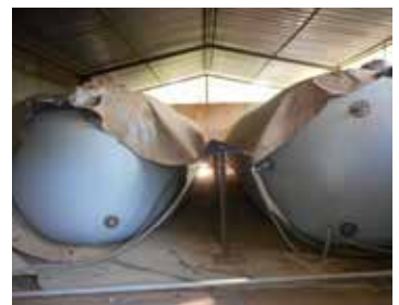
Unité d'alimentation du Transpaille® et les gazomètres à Teriya Bugu