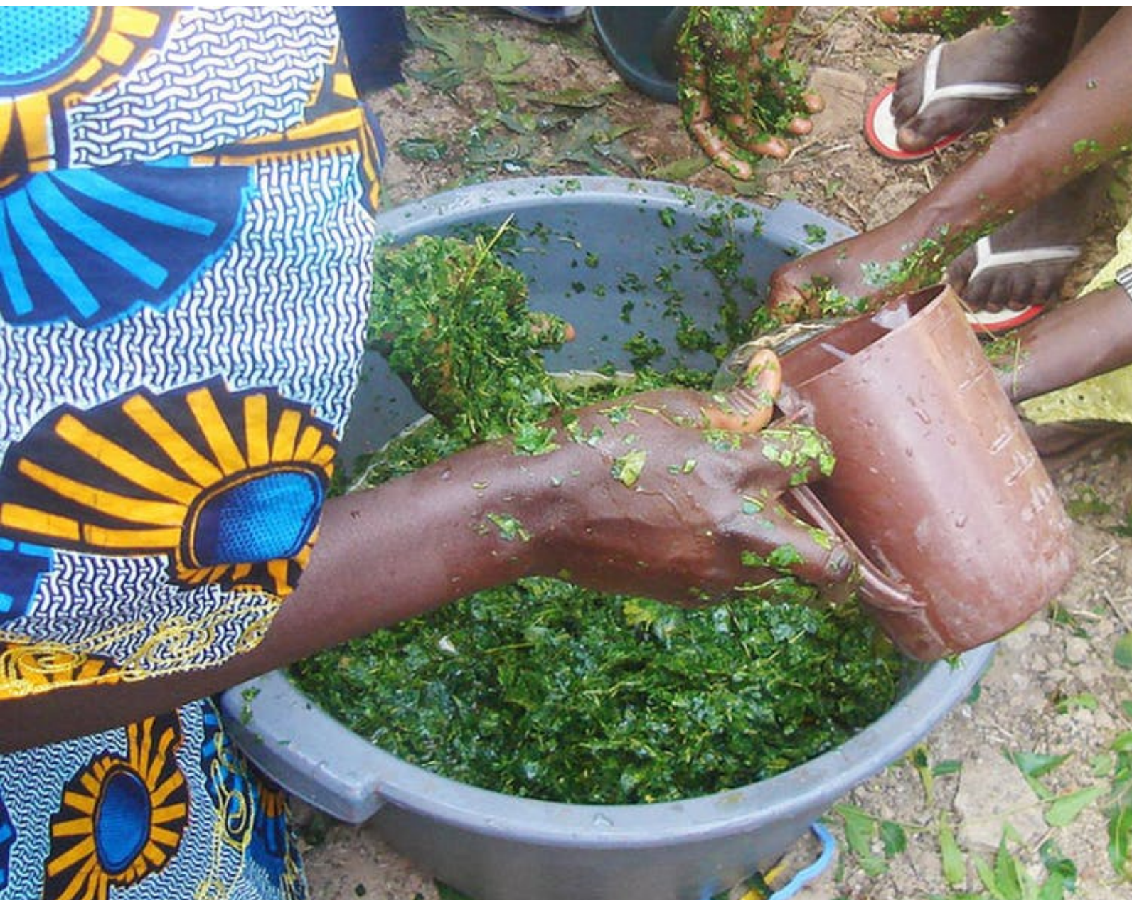
Préparation d'extraits de feuilles de neem au Sénégal pour application en culture cotonnière.

Enfin, ces dernières ne peuvent s'inscrire dans les démarches d'évaluation requises par les (rares) cadres réglementaires existants. Ces derniers, très lourds, sont en effet les mêmes que ceux exigés pour les pesticides de synthèse, et les petites structures de production ne peuvent s'y conformer. Cette contrainte, notamment, limite la viabilité commerciale des plantes pesticides.