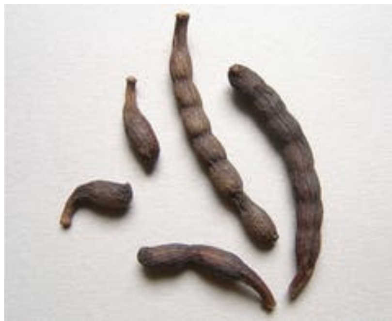
Poivre de Guinée.

Les plantes pesticides n'éliminent pas la totalité des ravageurs, mais maintiennent leurs populations en dessous du seuil de nuisibilité, tout en présentant de nombreux avantages sur les pesticides de synthèse.