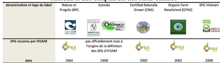
Tableau 1. Les cinq labels des MAB étudiés

avec les membres des groupes locaux et des commissions nationales entre 2014 et 2017.