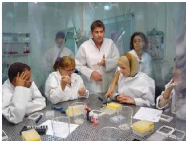
Fig. 2 - Formation de techniciens de laboratoire au Maroc (CIRAD, 2011). © CIRAD

Des formations intensives d'une semaine sur les méthodes de diagnostic de la PPR sont également proposées chaque année par les Laboratoires de référence de l'OIE aux techniciens de laboratoire des pays candidats. En 2017, plus de 30 techniciens en provenance de 16 pays ont reçu une formation au diagnostic de la PPR dans ces laboratoires (Figs 3 et 4).