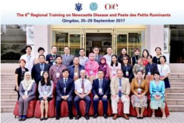
Fig. 4 - 6 e symposium et formation régionale en matière de diagnostic de la maladie de Newcastle et de la PPR (Qingdao, Chine, 2017)

Cette formation permettra d'éradiquer plus facilement la maladie et contribuera en outre à sa prévention dans les pays indemnes de la maladie. Dans certains cas, la formation peut être organisée dans un laboratoire de diagnostic du pays concerné. Une formation in situ a en particulier été dispensée par le CIRAD en Géorgie, après l'apparition du premier cas de PPR jamais enregistré dans ce pays, en 2016, ainsi qu'au Mali, pour les six pays participant au Projet régional d'appui au pastoralisme au Sahel (PRAPS) financé par la Banque mondiale (Fig. 5). Les Laboratoires de référence de l'OIE organisent également des évaluations de compétence qui permettent aux laboratoires participants d'évaluer leur capacité à mettre en œuvre les tests de diagnostic de la PPR.