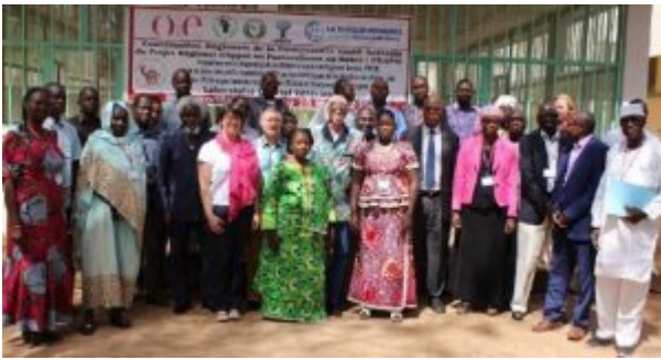
Fig. 5 - Cérémonie d'ouverture du programme de formation aux méthodes de diagnostic proposé par le CIRAD dans le cadre du projet PRAPS (Bamako, Mali, 2017)

En outre, les Laboratoires de référence de l'OIE proposent aux Membres de l'OIE, sur demande, leur expertise et leurs services de diagnostic. En septembre 2016, dix échantillons en provenance de Mongolie ont été envoyés au Laboratoire de référence situé en Chine pour confirmation d'une suspicion d'infection par la PPR. Ces échantillons ont tous été testés positifs au virus en laboratoire. Il s'agissait du premier épisode de PPR en Mongolie. De même, l'épisode de PPR de 2016 en Géorgie ne fut découvert que lorsque les échantillons préalablement envoyés au Laboratoire de référence de Pirbright pour une recherche de la fièvre catarrhale du mouton revinrent avec des résultats négatifs. Soumis ensuite à une recherche du virus de la PPR (PPRV), ils se sont alors révélés positifs.