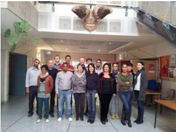
Fig. 3 - Formation conjointe Union européenne/OIE aux méthodes de diagnostic de la PPR (CIRAD, 2017)